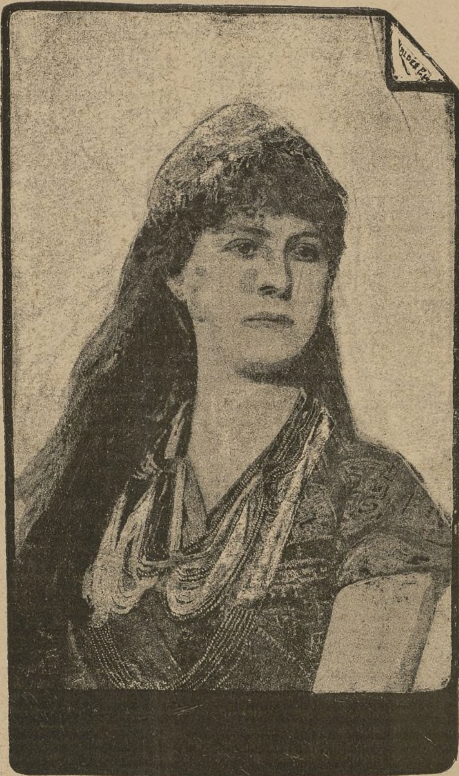
LA PRIMA DONNA MLE. MARIE VAN-ZANDT