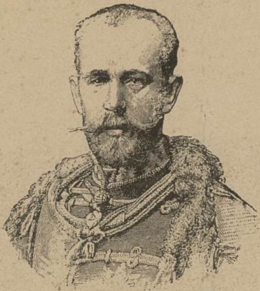
EL ARCHIDUQUE RODOLFO

HEREDERO DE LA CORONA IMPERIAL DE AUSTRIA † en Meyrling el 29 de Enero último.