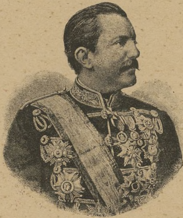
EX REY MILANO I DE SERBIA