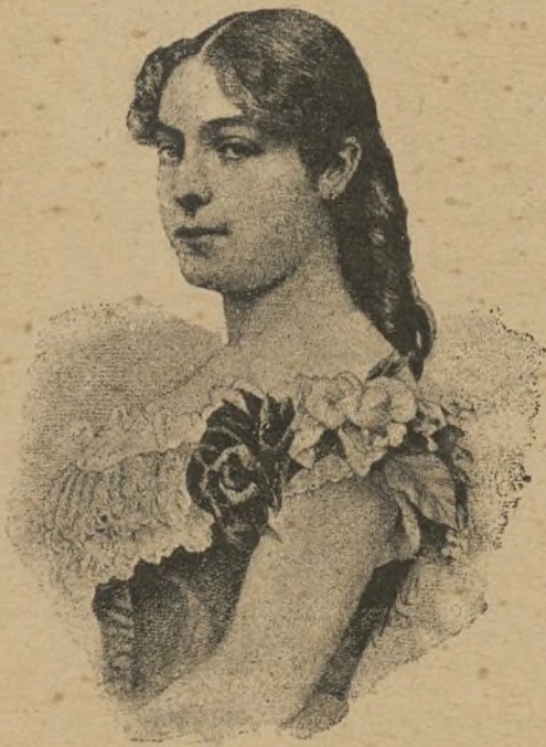
EX REINA NATALIA