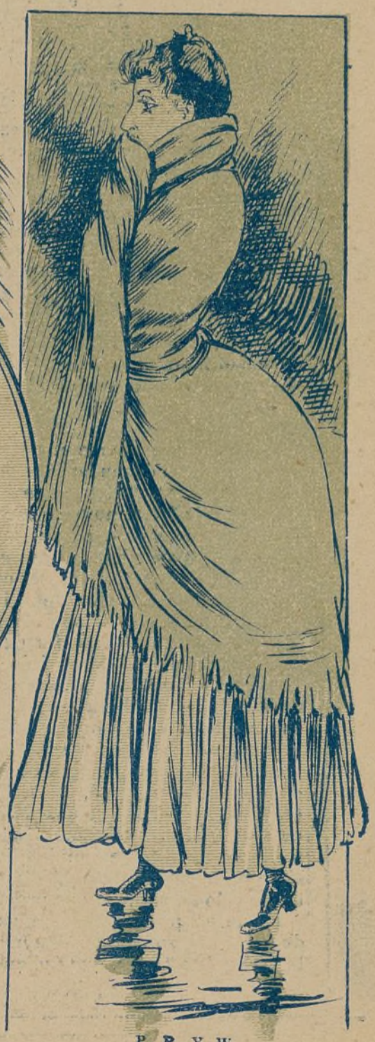
P. P. Y W.