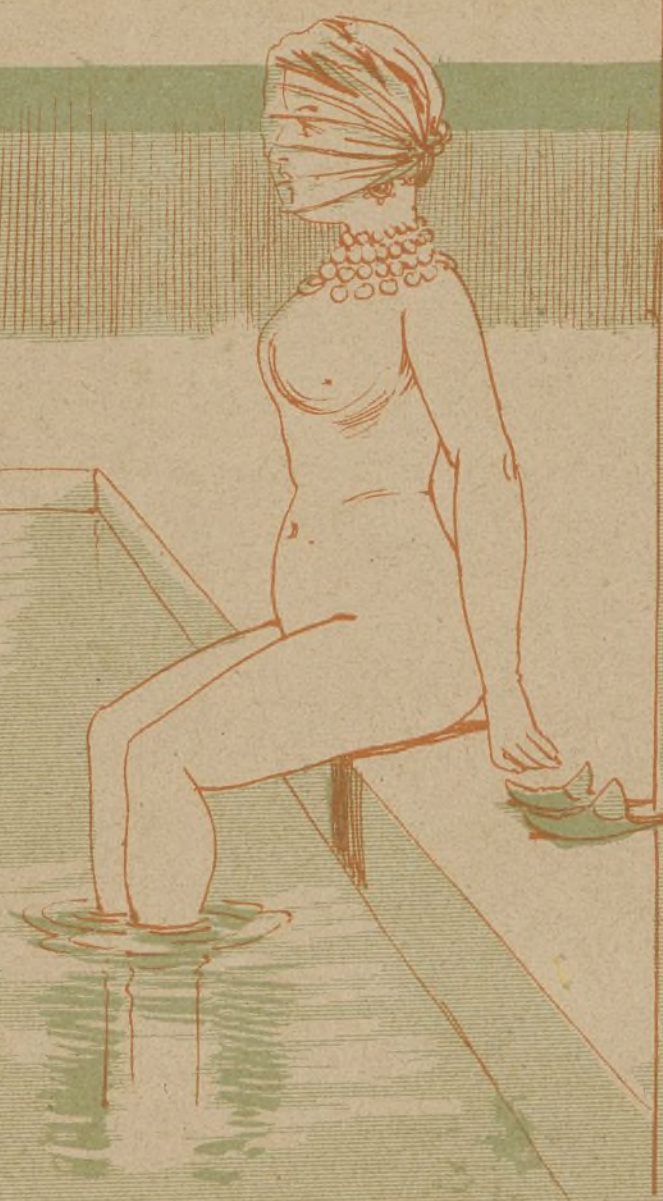
Traje de baño de la mujer marroquí. Lo esencial es taparse la cara para que no la conozcan. En lo demás, todas son iguales, y no hay para qué cubrirlo.