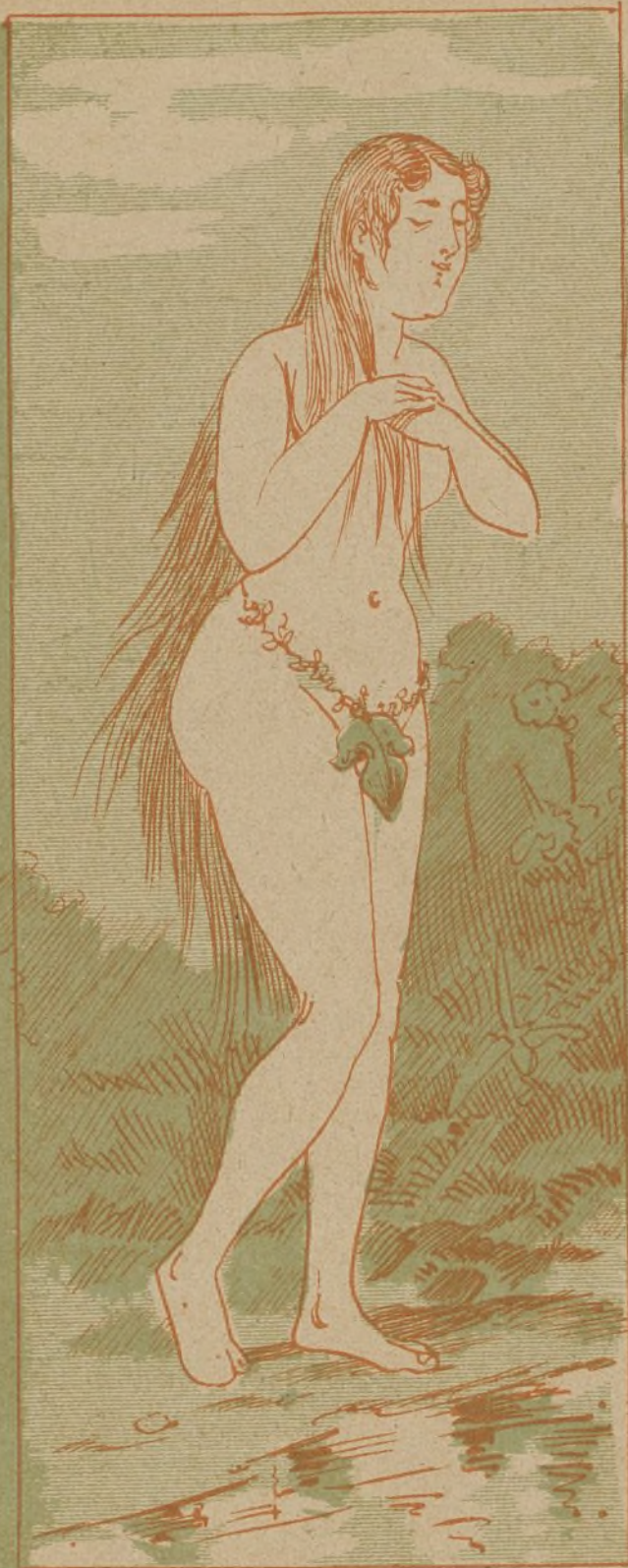
El segundo traje de baño, según los documentos más autorizados de la época. El otro, el anterior á la hoja, no se ha podido hallar.