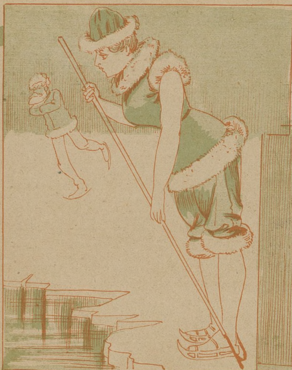
La princesa Kaskaraff de Huevoff preparando su baño en los hielos de la Siberia. ¡Con un friófi...