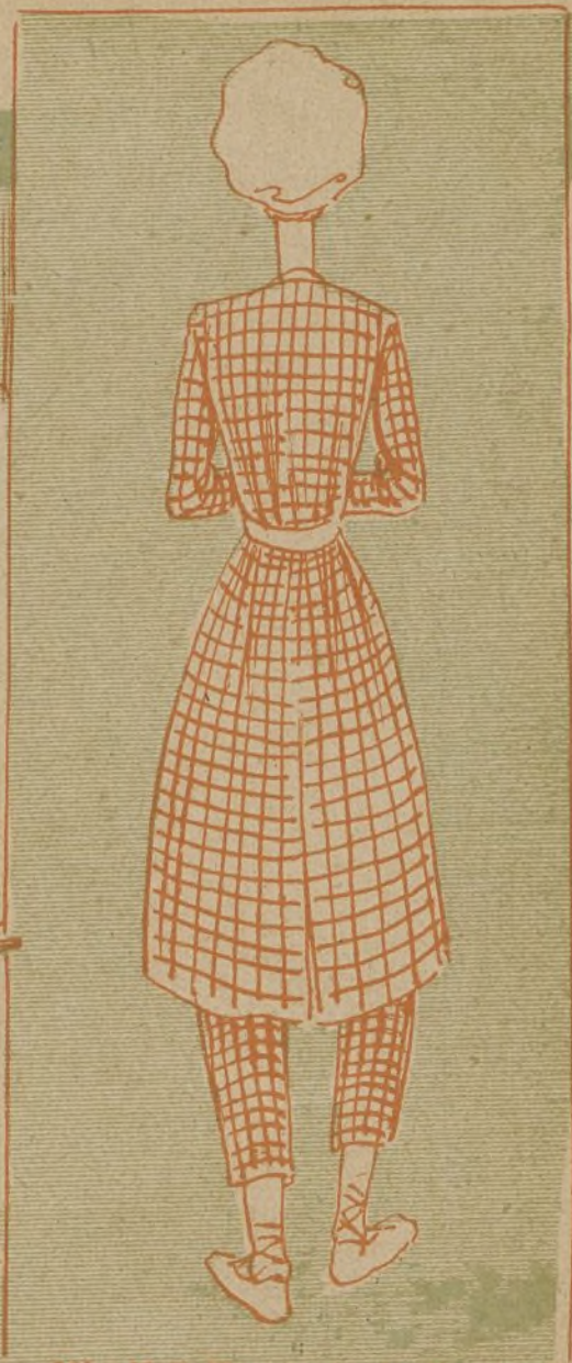
Miss N. S. Kensingtonby Rowland's.—London, 103, Fleet Street.—¡Y la censuran sus amigas porque el traje es algo libre!