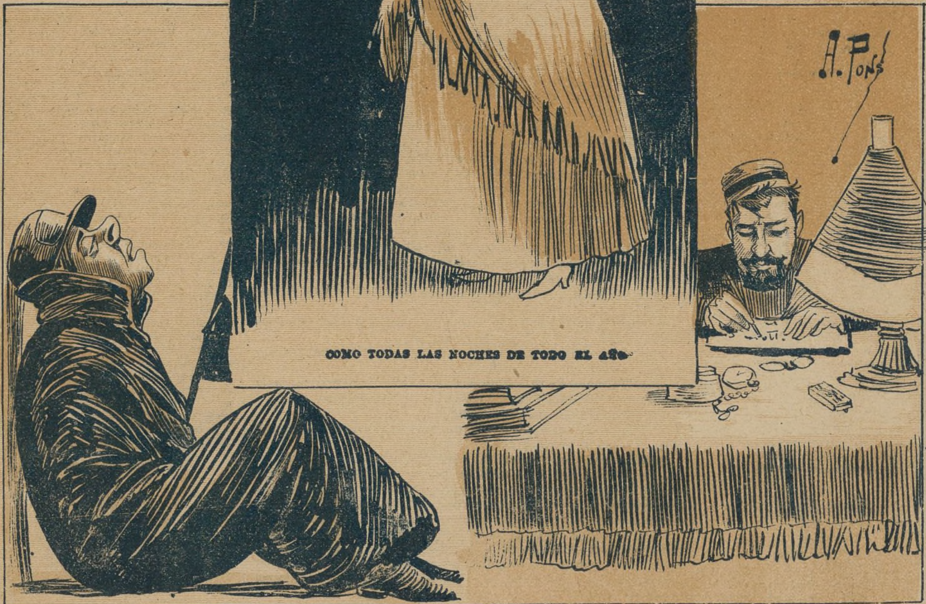
LA DEL CENTINELA