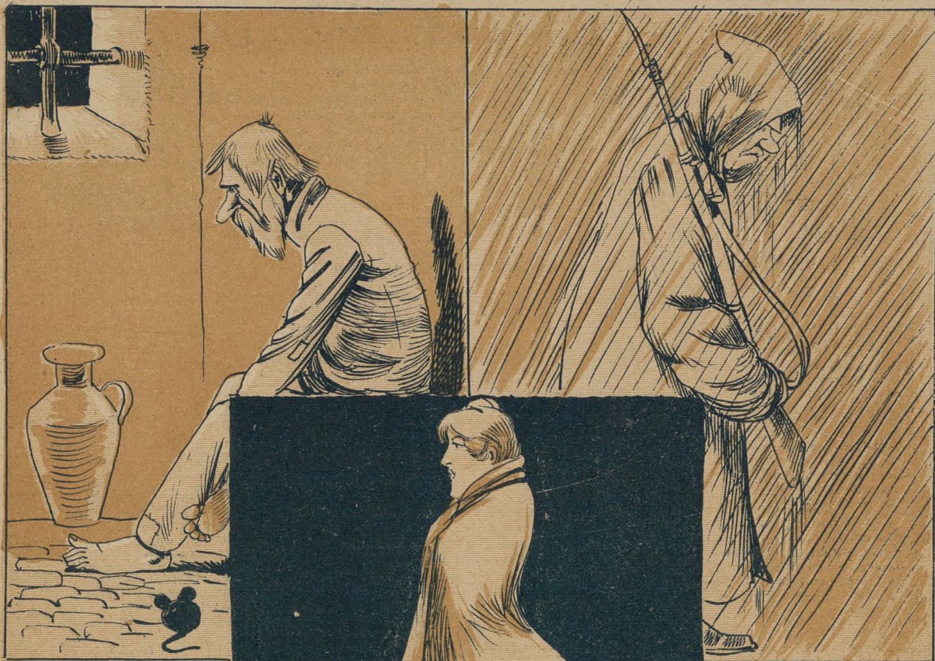
LA DEL PRESO