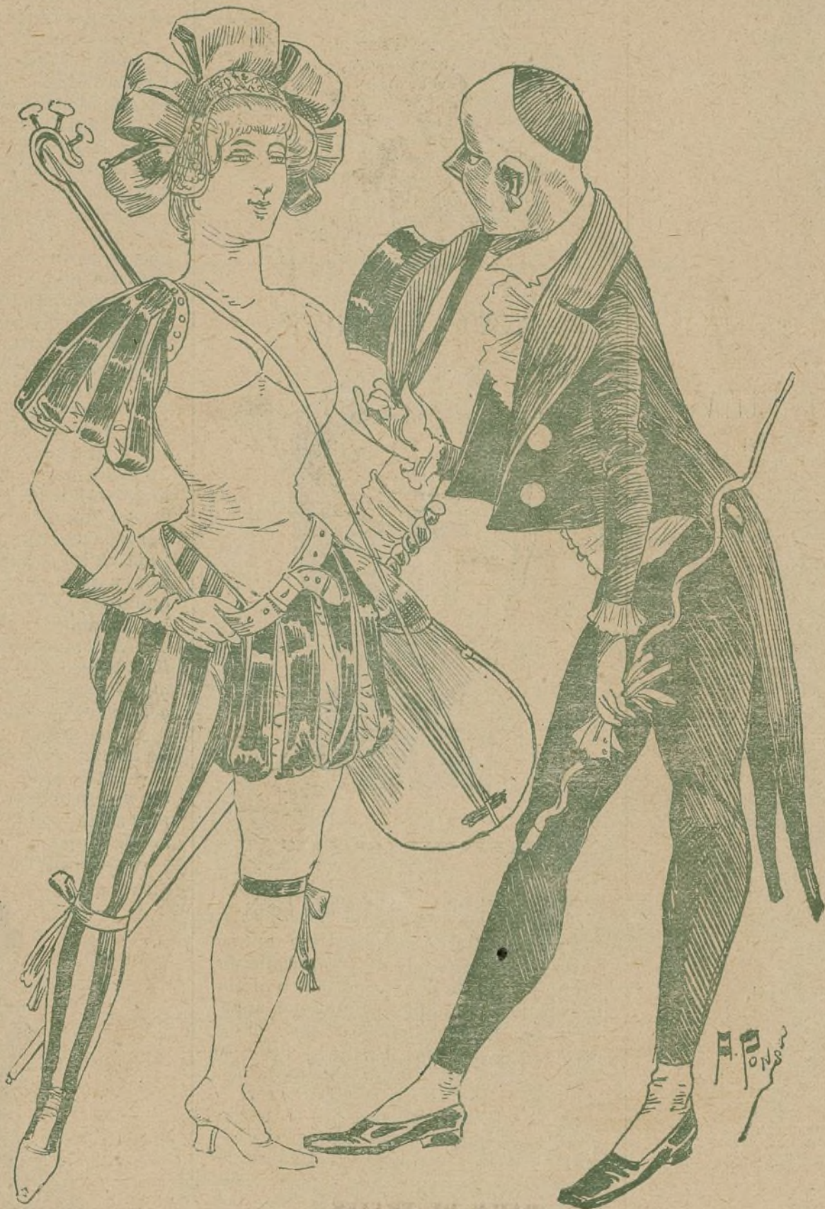
BAILE DE TRAJES

—¡Debe hacer mucho daño, pensó, la bala que entra candente, destrozando nuestra carne, mutilando nuestro cuerpo!