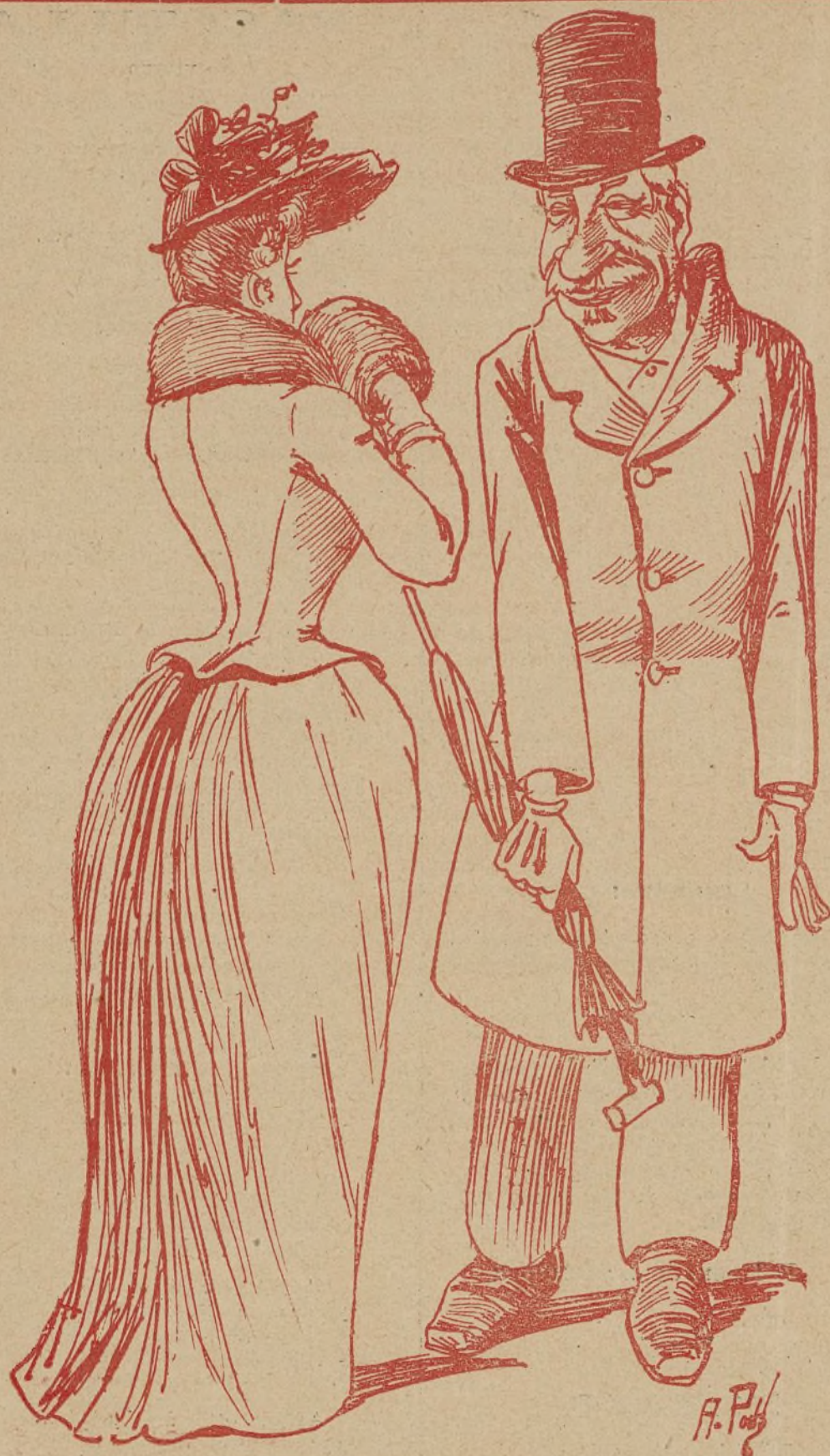
VILLAZOQUETE EN MADRID

—Siempre que vengo á Madrid y veo una de éstas, se me ocurren exactamente las mismas barbaridades que el año anterior.