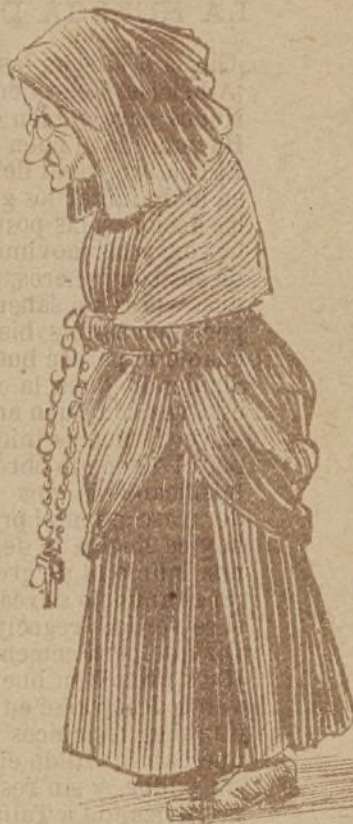
Dos de Mayo 1890

Hace pocos días entró en una iglesia pro- testante de Londres, durante los oficios, un oso de un domador ambulante, se fué á un banco y se sentó.