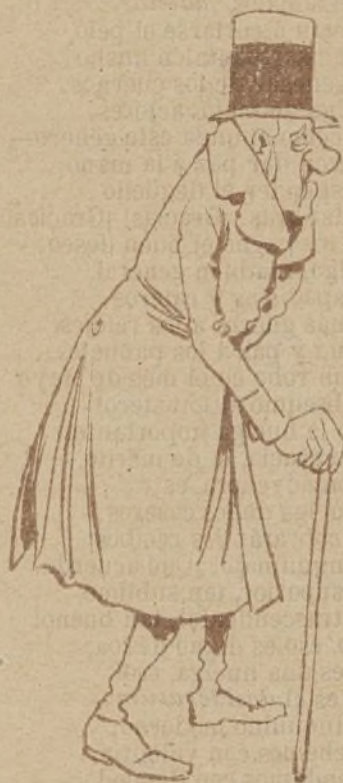
Dos de Mayo 1890

¡Cómo que se trata de tabaco picado, com- pañero!