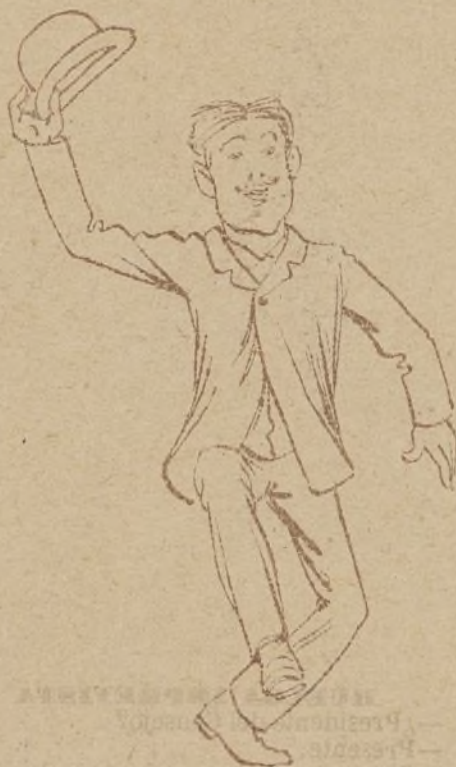
EL ESTUDIANTE.—¡Ya no hay clases!

obrero que se pasa la vida en la Puerta del Sol. Que es un obrero honorario, como yo burgués. Que él sufre por el trabajo de los otros como yo por el capital de los demás.