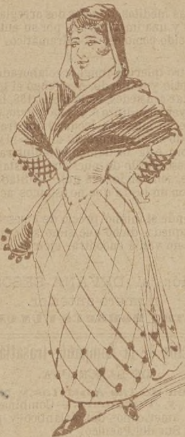
Dos de Mayo 1808

que ya la remoce... Yo la quiero mucho. JUAN Sí; ya se conoce. INÉS Pues desde allí iban á ver á Isidora, que es la criatura más murmuradora... No sabe usted, joven, lo que á mí me carga. No hay genio más malo ni hay lengua más larga. Todo lo critica, todo lo censura, de todo habla pestes, de todo murmura. En todo ve falta y encuentra defecto y nada cree santo ni juzga perfecto. Y eso que ella es una... No es por ofenderla mas no tiene el diablo por donde cogerla. Estuvo casada con un subteniente, que ya hace dos años murió de repente.