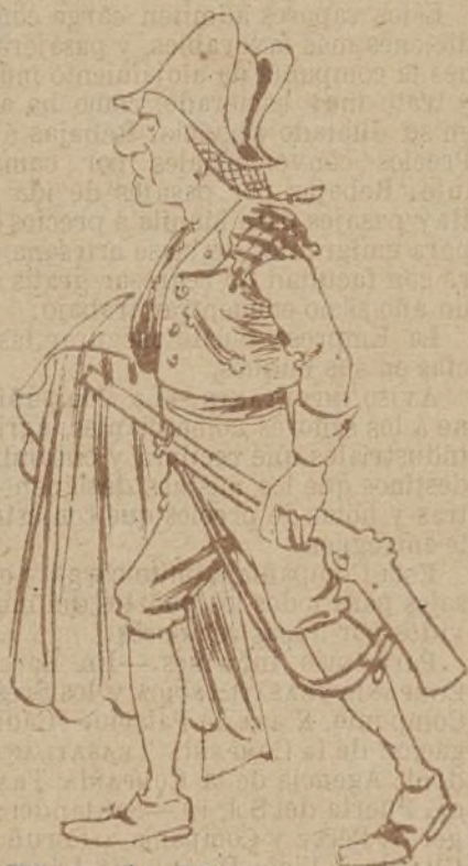
Dos de Mayo 1808

que ya la remoce... Yo la quiero mucho. JUAN Sí; ya se conoce. INÉS Pues desde allí iban á ver á Isidora, que es la criatura más murmuradora... No sabe usted, joven, lo que á mí me carga. No hay genio más malo ni hay lengua más larga. Todo lo critica, todo lo censura, de todo habla pestes, de todo murmura. En todo ve falta y encuentra defecto y nada cree santo ni juzga perfecto. Y eso que ella es una... No es por ofenderla mas no tiene el diablo por donde cogerla. Estuvo casada con un subteniente, que ya hace dos años murió de repente.