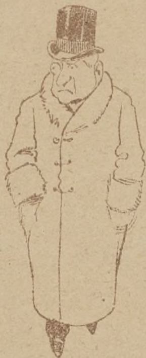
—¿Qué es esto? ¿Ya no hay clases?