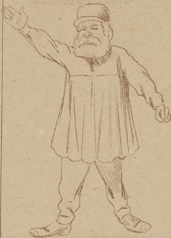
Abajo las clases privilegiadas.