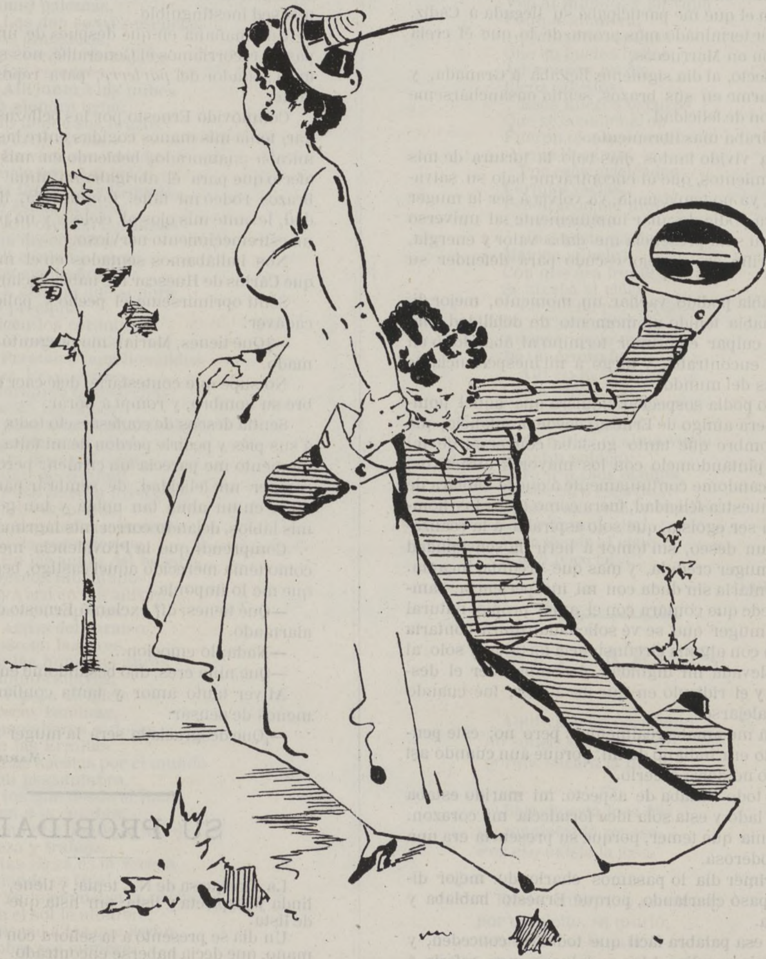
—Acabe V. hijo, que allí viene la seccion de ciencias!