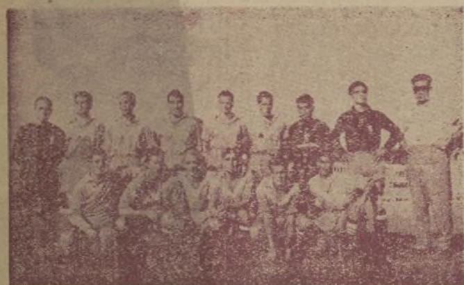
El equipo del "Badalona", gran vencedor del "Constancia" en la...