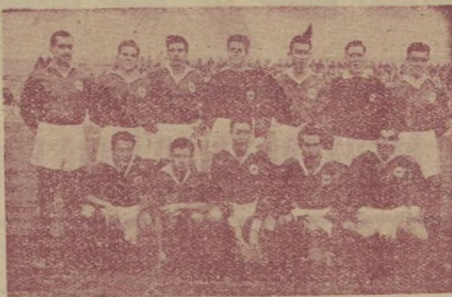
El Tarragona, que causó excelente impresión.