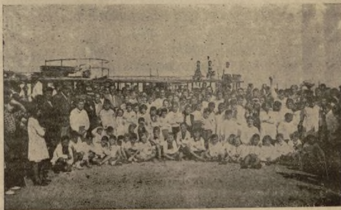
Niños que concurren a las escuelas de la casa del Pescador de Vigo