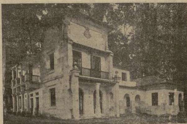
Vista del edificio de la «Institución Valeriola» «Casa del Pescador» de Vigo donación ejemplar del Excmo. Sr. Marqués de Valterra, Jefe del Servicio Nacional de Pesca, y donde recientemente se han realizado obras para ampliación de plazas de ancianos pescadores allí acogidos