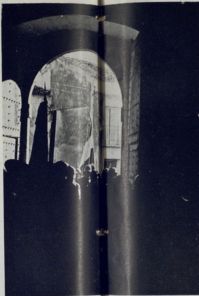
Vista de la entrega nuestra Bandera en el Cuartel general