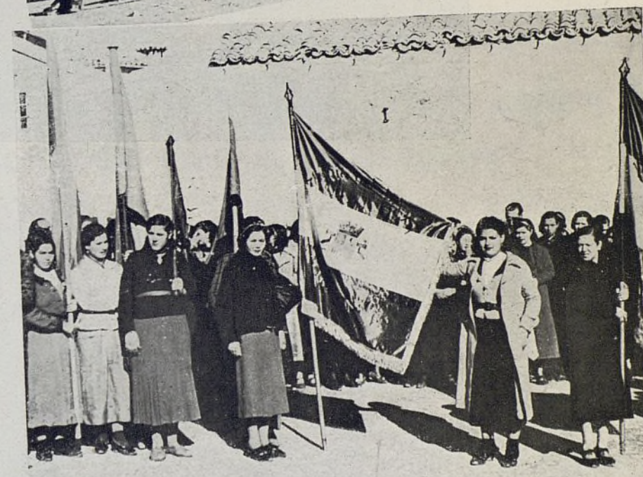
Momento de hacerse cargo las madrinas de las Banderas