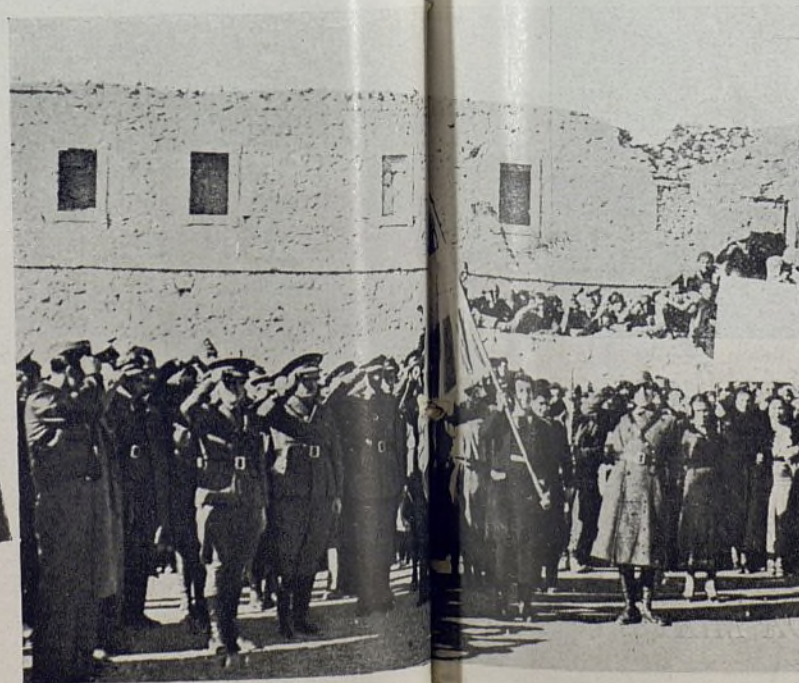
Solemne entrega a la Bra de la enseña Patria