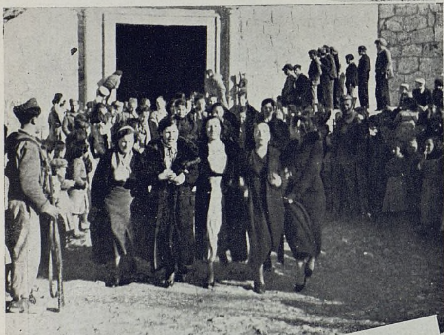
El pueblo unido al Ejército