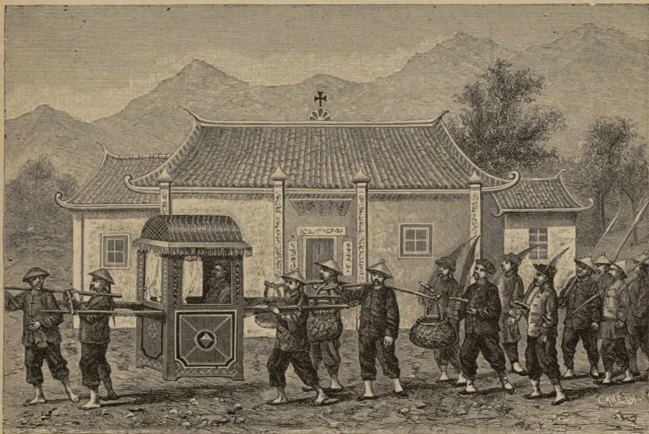
KUANG-SI (China). — Partida de Kuy-hien en palanquín. (Pág. 87).

Bien quisiera enviar á V. R. una relacion acerca de este partido ; pero no puedo verificarlo, porque aún no estoy bien enterado. Sólo diré á V. R., que estos cristianos son muy dóciles y me agradan sobremanera. Y, si bien este pueblo se halla entre dos, cuyos habitantes son