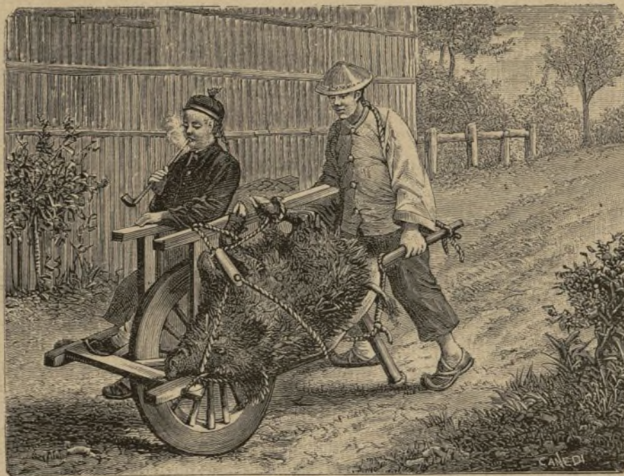
KUANG-SI (China).—Carretón chino.