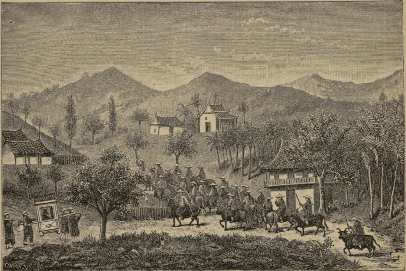
KUANG-SI (China). — Encuentro de un rebaño de búfalos. (Pág. 90).

«Las Misiones de los Jesuitas en Madagascar, segun es sabido, estaban muy florecientes por el número de iglesias, escuelas, hospitales, hospicios y otros establecimientos de piedad y de beneficencia, que los beneméritos Padres de la Compañía de Jesús tenían fundados y que prosperaban. Por otra parte los católicos del Madagascar son bastante numerosos y muy bien vistos, y además porque cuentan en sus filas un buen número de per-