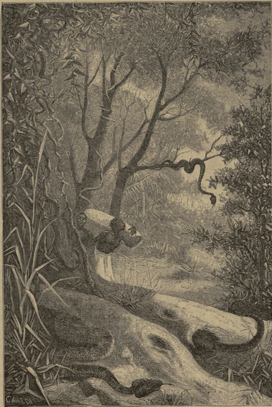
ZANGUEBAR. — Nido de serpientes en Mirambo. (Pág. 424).

Encontrámonos en un vasto país de colonizacion. Comunmente el viajero que remonta el Ottawa, viajando desde Pembroke entre masas de granito, imagínase que sólo hay allí una sucesion no interrumpida de montañas resquebrajadas y de peñas desnudas hasta el polo Norte. Admirando los puntos de vista de Temiscamingue, dignos de los Alpes y de Suiza, no sospecha que á una milla de la playa se encuentra un suelo unido, tan fértil y de fácil laboreo como el de los alrededores de Montreal.