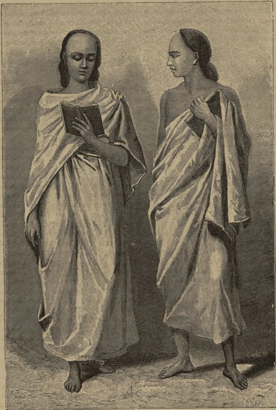
MADURÉ (Indostan). — Dos jóvenes brahmas del colegio de Padres Jesuitas de Trichinopoly. (Pág. 440).

Ya han comenzado á contraer enlaces matrimoniales los silipanes de aquellas cercanías con algunos del