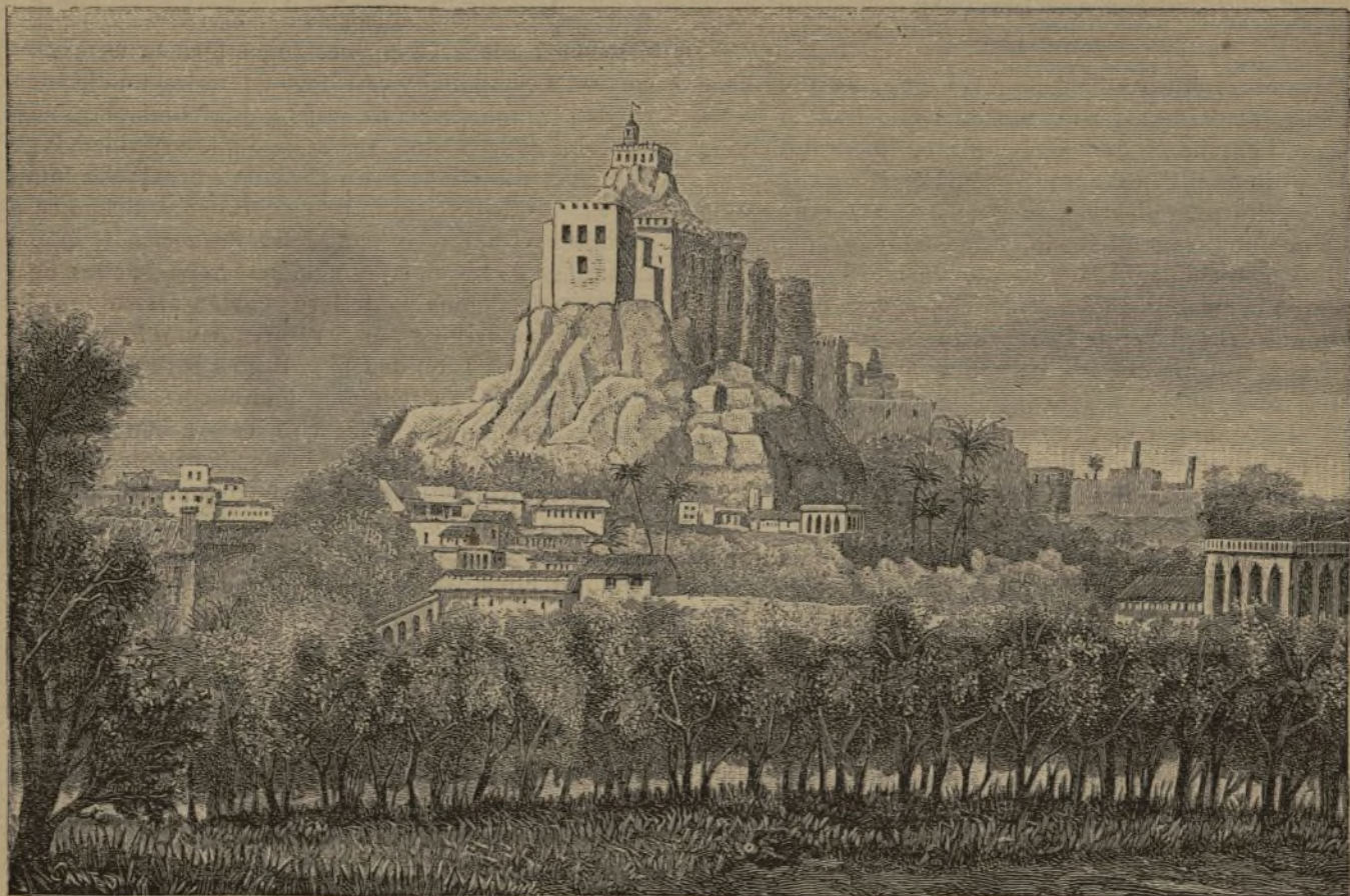
MADURÉ (Indostan). — Fuerte de Trichinopoly.

Nadie más fino, amable, elegante é inteligente como los jóvenes brahmas: su ardor por el estudio es incomparable: son capaces de mendigar para comprar un libro: fatíganse cuatro ó cinco en torno de un velon que sólo dá un pálido reflejo de luz: pasan así gran parte de la noche estudiando; levántanse antes del día, y tienen casi continuamente el libro en la mano. En todo esto parece entra por mucho la ambicion, pues les consta que su porvenir, los honores y las riquezas dependen de su éxito en los exámenes del Gobierno. En efecto, es en gran parte por este medio que pueden conservar el ascendiente y la preponderancia de su raza, tan decaída desde la dominacion extranjera.