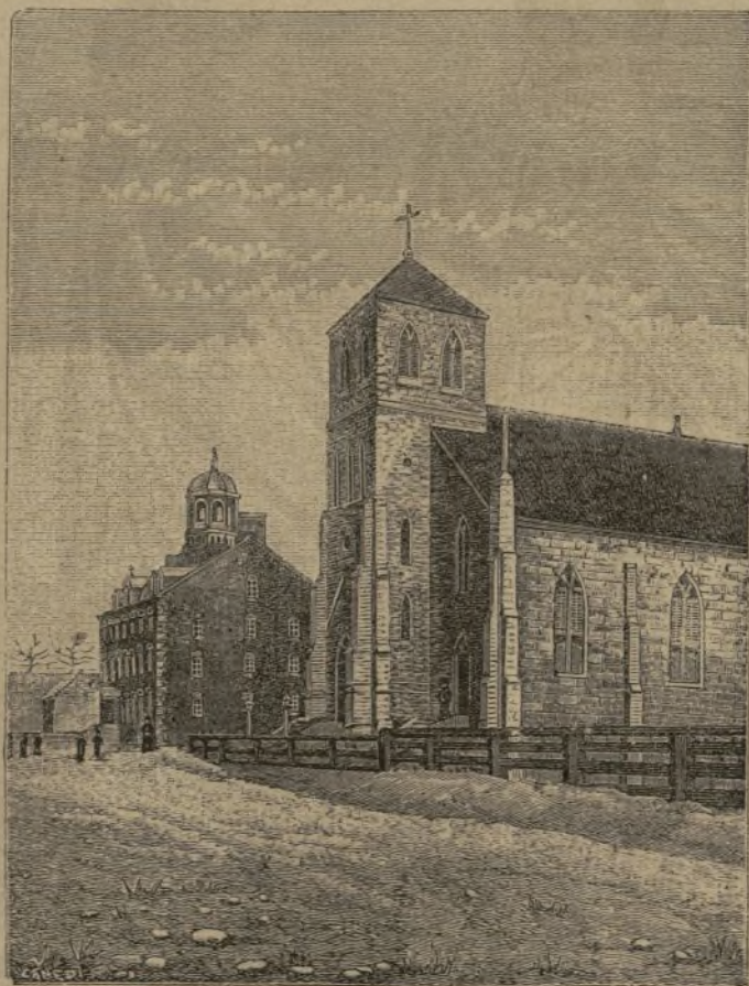
CANADÁ. — Iglesia y convento de Pembroke, de una fotografía enviada por el Ilmo. Lorrain. (Pág. 429).

llamada Baguingues y un grupito en otro punto denominado Murung, y las de Dinapungan y Umbuc. Pero, ciertamente, P. N., el territorio y sementeras de Ibaay, Ambabag, Pindungan y otros de las cercanías parecen despreciables, á pesar de lo buenos que son, en comparacion de los que como digo se hallan abandonados y medio cubiertos de bosque y maleza. Por todo esto calculo yo que si volviese á poblarse tan fértil y espacioso lugar podría dar alimento y vida á un pueblo de ochocientas ó mil casas, incluyendo las rancherías de Ibaay, Ambabag y Pindungan, y esto sin contar las de la otra parte del Ibulau. Ahora comprendo por qué se habla en la Historia de las Misiones de Quiangan como de un gran valle . «El gran valle del Quiangan, se decia casi en mi tiempo, sien