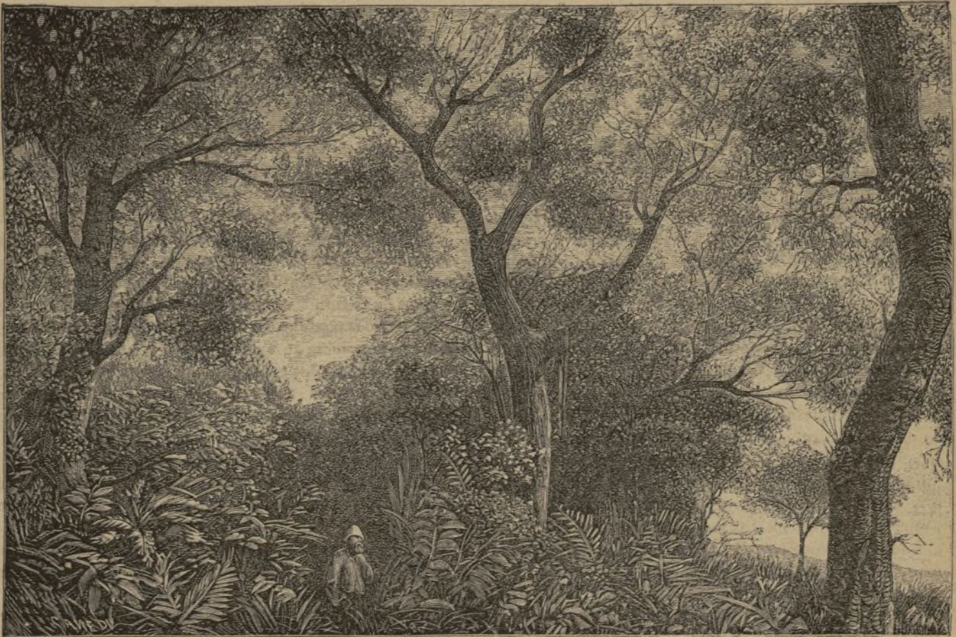
ZANGUEBAR. — Arbol gigantesco en la entrada de un oasis. (Pág. 423).

dimos este largo viaje. Parécenos oír las palabras del divino Maestro que nos dice como á los Apóstoles: Requiescite pusillum : «Descansad un poco.» El lugar nos invita á ello y nos trae su consolador augurio, pues para decirlo al terminar, el nombre Bagamoyo , formado de Baga ó Bwaga (depositar) y de moyo (corazon), no tiene otra significacion que este suave y místico pensamiento traducido en forma de invitación: Descansa tu corazon .