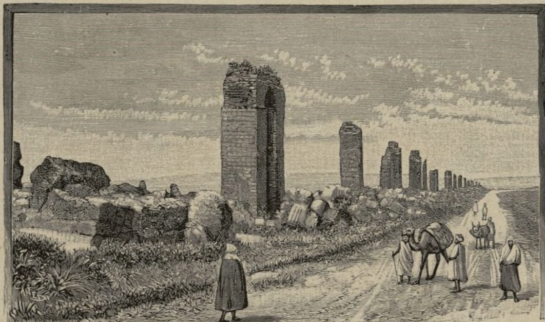
TÚNEZ.— Pilares del acueducto púnico. (Pág. 65)

Lo que más nos duele ahora es que nuestra Misión carezca aún de iglesia, pues no merece tal nombre el local que cobija el Santísimo Sacramento y á los fieles; de tan pésimas condiciones que se cuele el agua por todas partes. El último domingo, sin ir más lejos, desencadenóse una tempestad mientras estaba en el púlpito, y tuve que interrumpirme para dar tiempo á que los fieles se agrupasen lo mejor posible en el sitio donde llovía menos. Es imposible reparar el techo; sería preciso renovarlo, y para esto substituir las paredes, que son simplemente de tierra: es decir, no hay otro remedio que construir una nueva iglesia. He expuesto nuestros apuros al vicario apostólico, Ilmo. Gaughrán; pero con