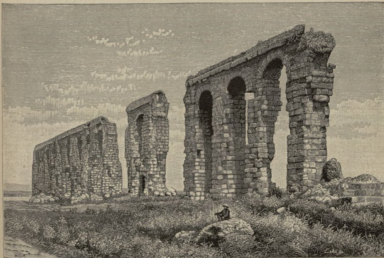
TÚNEZ.—Acueducto romano de Zaghuán, en Cartago. (Pág. 63)

pedía al mandarín local que prestase sus buenos oficios de padre del pueblo para aplacar la discordia entre cristianos y paganos. El misionero intentó arreglar las paces por medio de un convenio; pero no pudiendo conseguirlo, porque los ánimos estaban demasiado enconados, se presentó al mandarín con la referida carta. El misionero católico fué bien recibido por el ilustrado discípulo de Confucio, si bien soltó una frase irónica, diciendo, «que los cristianos eran vasallos del Imperio, y por lo tanto estaban sujetos á las leyes patrias.» El misionero contestó, que no pretendía eximir á los neófitos de la ley común, cuando él mismo se sujetaba á ella en todo lo que no era contraria á la ley de Cristo y su Iglesia, y que el señor cónsul sólo le pedía en nombre de los tratados, que los cristianos fuesen juzgados