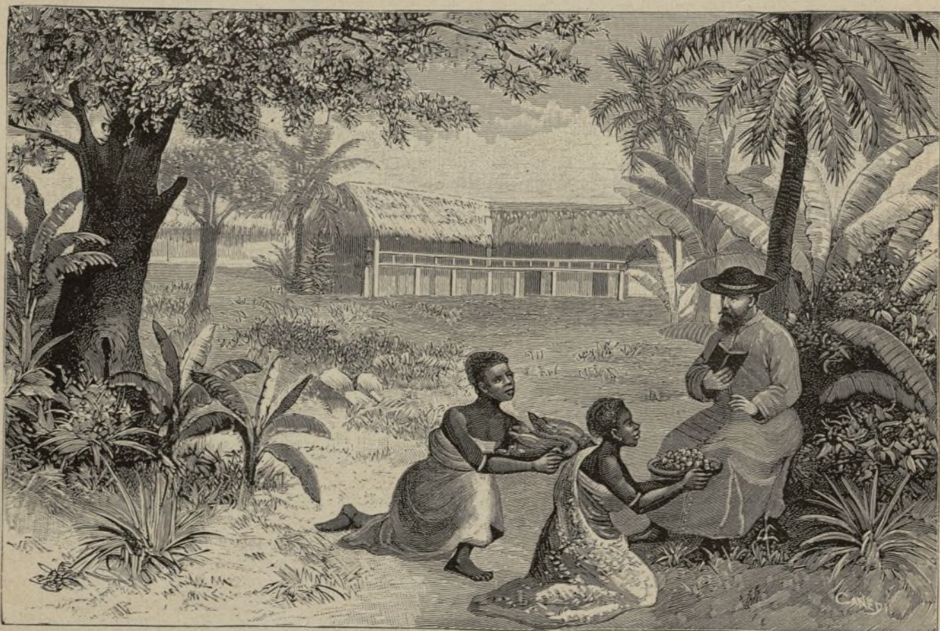
COSTA DE BENÍN ( Africa Occidental ) — Mujeres del rey ofreciendo al misionero pollas y acassas. (Pág. 67)

Riqueza de los judíos de Europa. —En Hungría, la cuarta parte de los votos reservados á los mayores propietarios corresponden á los judíos. Conquistaron la