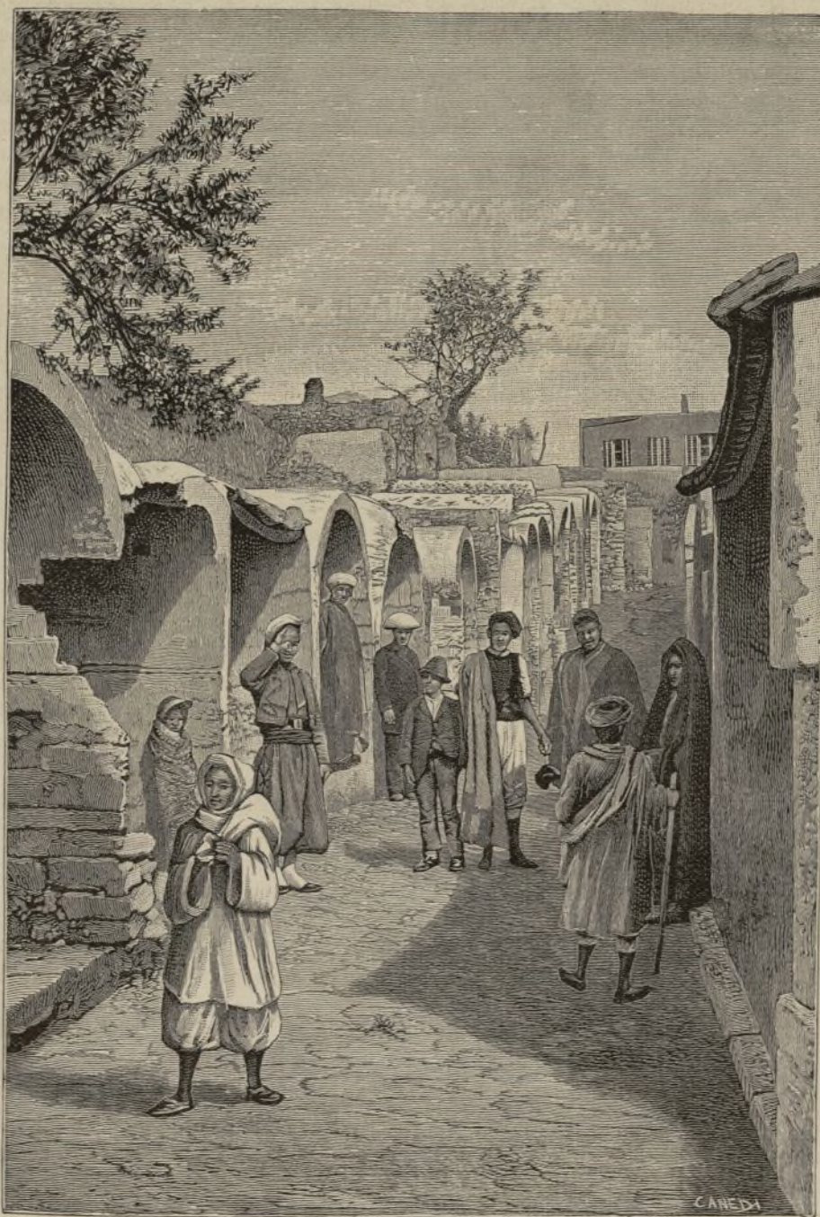
TÚNEZ.—Una calle de Zaghuan. (Pág. 66)

Jacob, que le costó cien ovejas. A este campo solían venir los hijos de aquel Patriarca á apacentar su ganado; y á él fué enviado José por su padre para que le diese noticia de sus hermanos, y no hallándolos, tuvo que ir á Dotain , donde los encontró; pero ellos le vendieron á los madianitas, quienes lo transportaron á Egipto y le vendieron á su vez á Putifar , eunuco de Faraón ó maestro de la milicia.