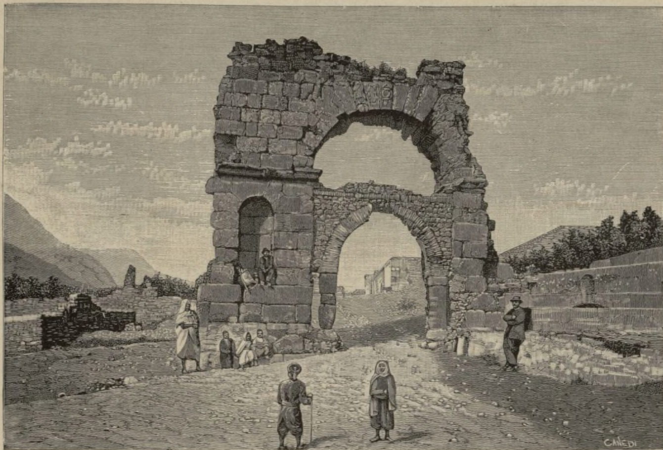
TÚNEZ.— Arco de triunfo en Zaghuán. (Pág. 66)

Santa Madre la Iglesia; el acontecimiento se ha solemnizado del mejor modo posible, y no entro en detalles por no alargarme más. Han sido éstos unos días de verdadera fiesta y regocijo popular. Ahora ya nos estamos disponiendo para la vuelta, en que iremos acabando de recoger la mies en los pueblos del tránsito, que todo en conjunto, con la de Milagro, será próximamente de unos mil cristianos. Este remate viene á coronar nuestros trabajos en el Bajo Agusan; perfeccionando aún la obra la fundación de Verdú, que se ha hecho un centro de población donde se recogen los alzados de toda la comarca desde Butuan á Guadalupe, y los muchos infieles del río Uaua, que han estado corriendo de aquí á Lianga, huyendo el cuerpo á los misioneros, que tanto bien les deseamos.