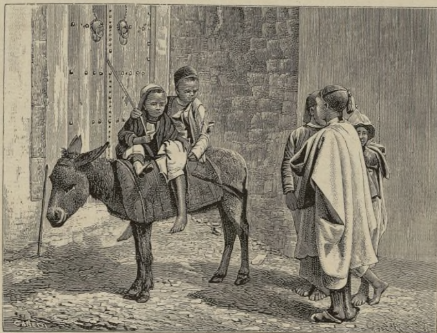
TÚNEZ.—Jóvenes árabes y su asno. (Pág. 65)

Fruto de este carácter es la completa sumisión de los hijos á los padres, de la esposa al marido, de los feligreses al párroco y de los ciudadanos á las Autoridades: son agradecidos á cualquier beneficio que reciben, y saben recompensarlo. Un hecho: varias familias, antes muy ricas, han caído en la miseria; sus antiguos