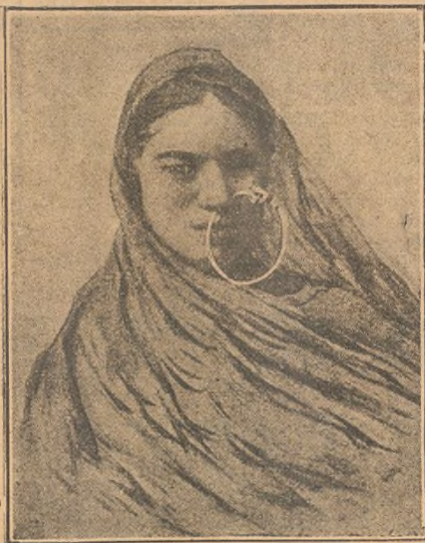
Novia india, con un aro en la nariz agujereada.

Por su parte la autora del texto, Flora Ami-