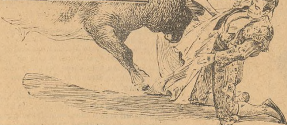
Grave cogida de Ricardo Torres "Bombita" en México.