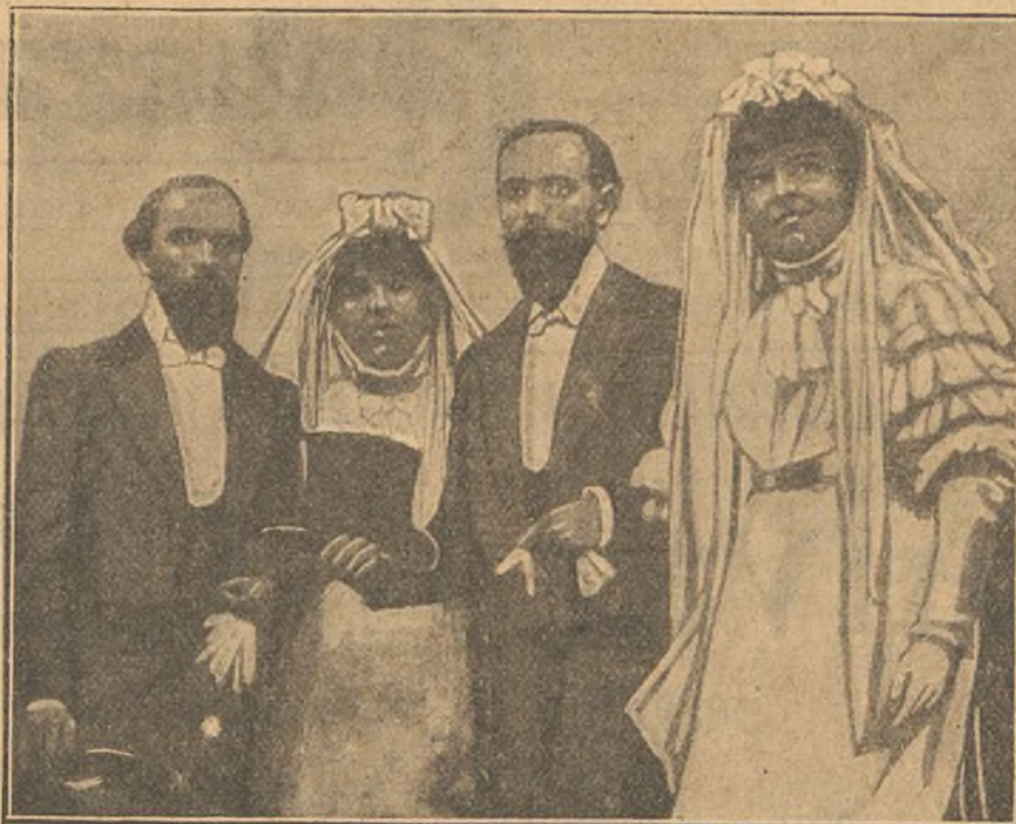
Matrimonio extraordinario. Dos gemelos que han casado en París, con dos gemelas.

"Las orientales tienen mucho que aprender y que enseñar á las occidentales. Ninguna hija de Occidente aceptará de buen grado casarse con el más hermoso y valiente caballero, si está enamorado de cualquiera destripa-terrones: pero de cada diez veces nueve la de Oriente se casa contenta con el que han elegido sus padres (y la déci-