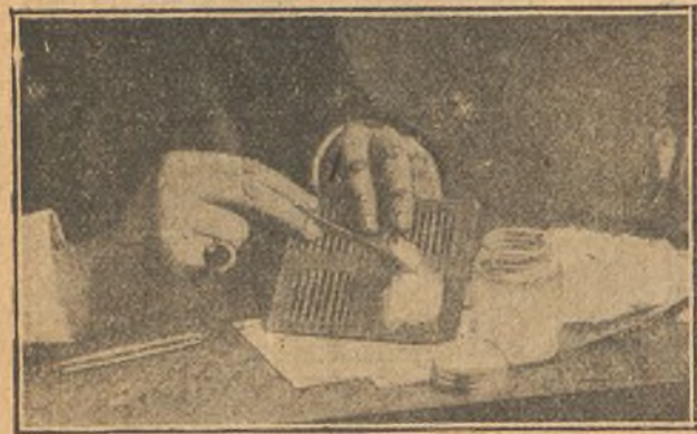
Extendiendo fulminato sobre papel plegado, para hacer una carta explosiva.

No hace mucho la policía postal rusa ha descubierto tres cartas explosivas dirigidas a tres ministros. No es la primera vez que se ha recurrido a ese procedimiento. La Grand Illustré de París publica una información al respecto proporcionada al colega por el Director del Laboratorio Químico Municipal de aquella gran villa. De ella tomamos las ilustraciones correspondientes completadas con datos del Daily Graphic de Londres.