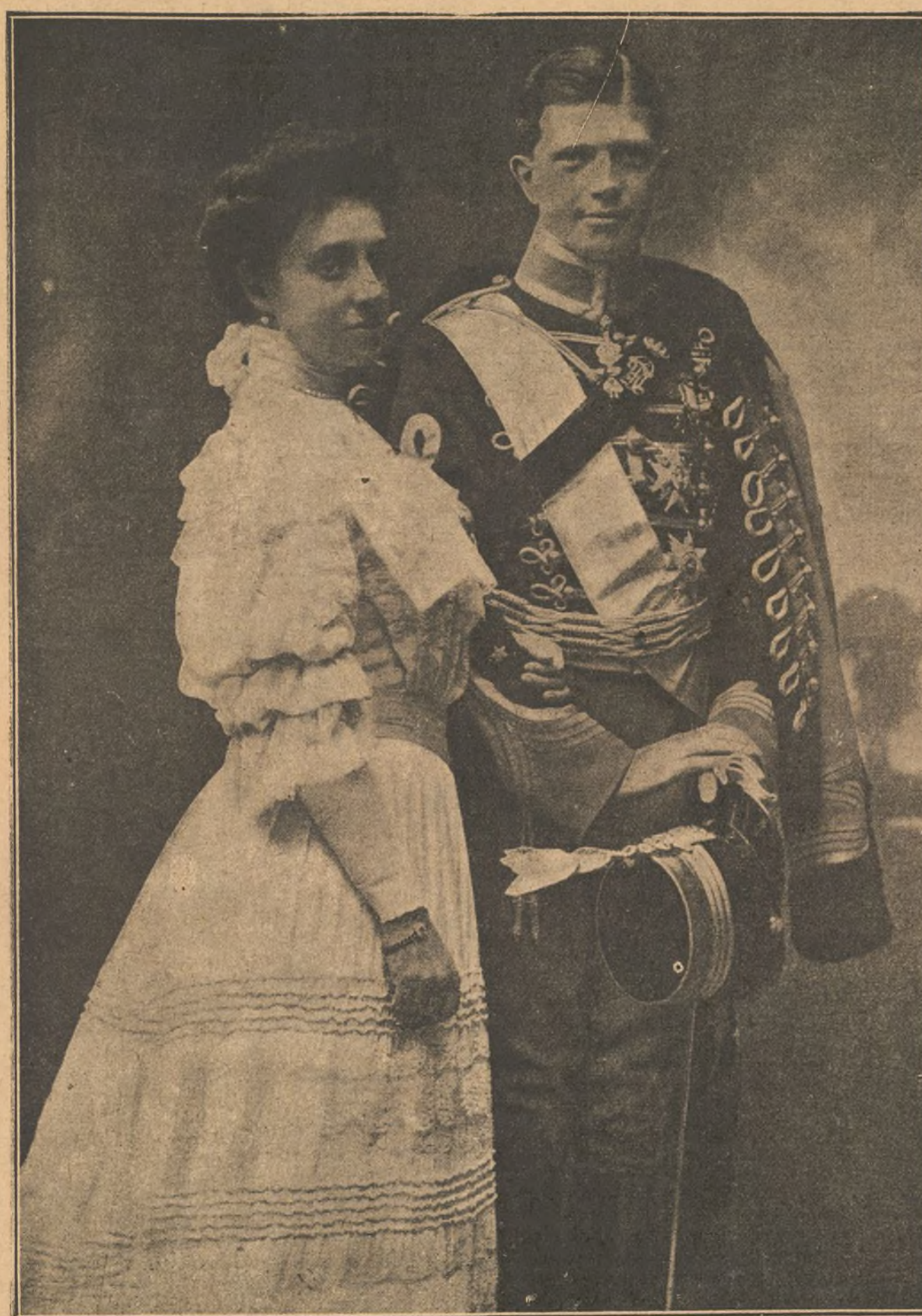
Los Infantes Doña María Teresa y D. Fernando de Baviera

merada labor de eliminación que dio por resultado el que, en vísperas del acto electoral, quedasen aquellos reducidos a cinco, entre los cuales los más probables eran Fallieres y Doumer. Así, al menos, lo decían los periódicos franceses.