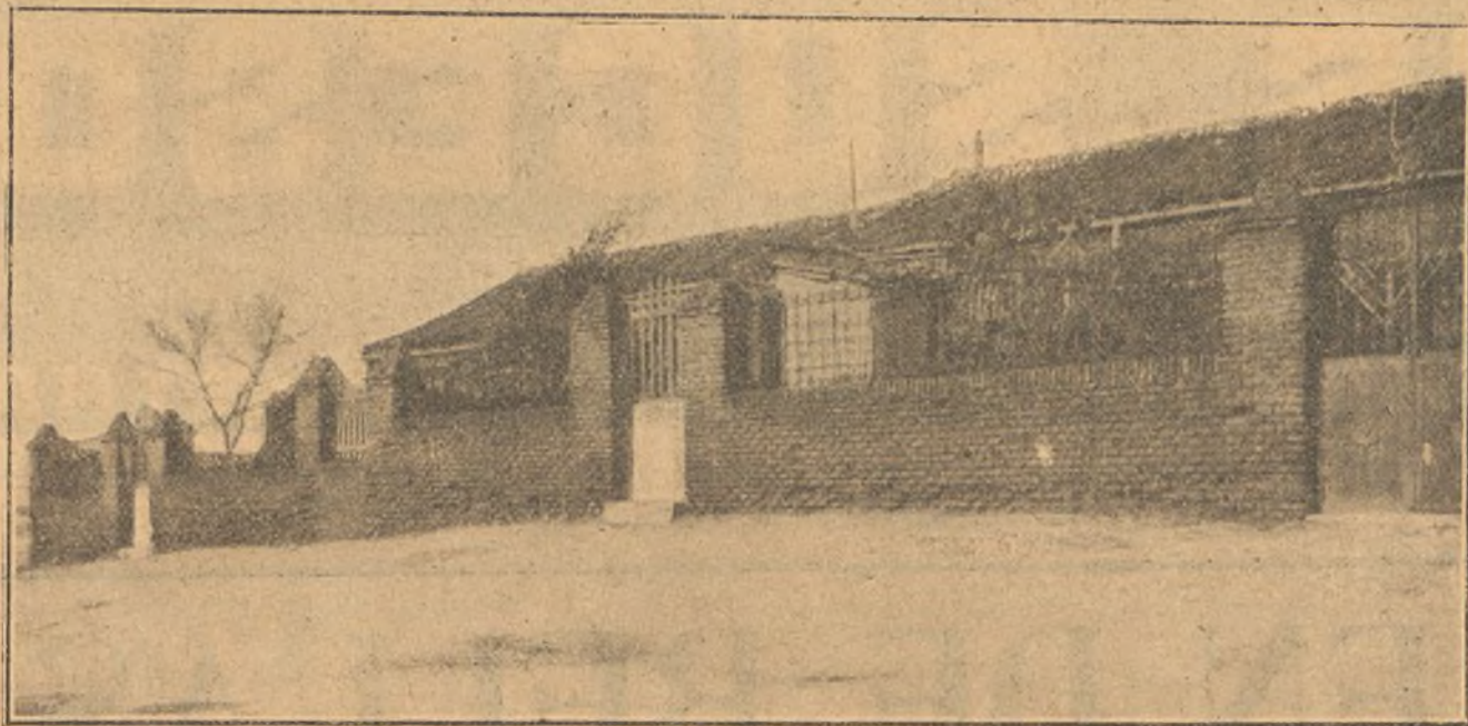
Exterior de la casa que habitaba D. Valentín Huertas y donde se realizó el crimen

No se sabe como, pero es lo cierto, que esta carta fué á caer en manos del guardia civil