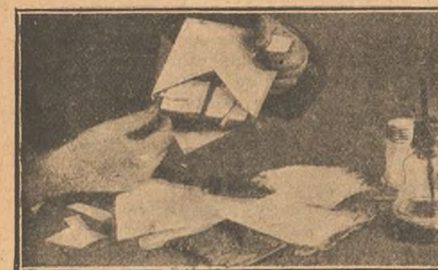
Colocando el explosivo en el sobre,

Es de fácil preparación, aunque difícil de comprar ya preparado; pero su receta hállese en los tratados de Química.