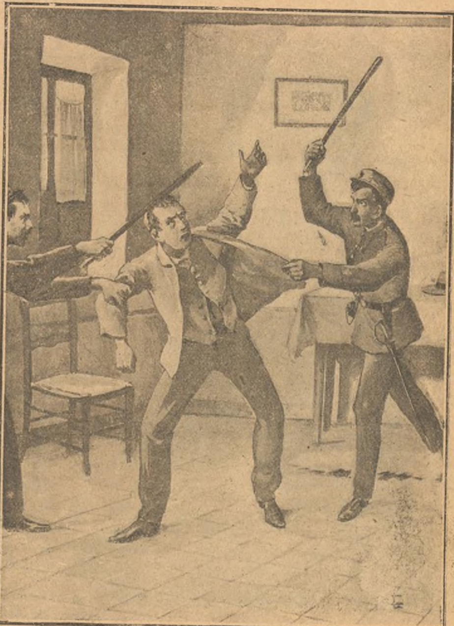
Dos guardias municipales apalean á un vecino de Peñaflores (Sevilla), allanando su domicilio.

El puente ha sido construido por la Empresa de un ferrocarril y sirve para el pasaje de personas, vehículos y los trenes de la compañía constructora.