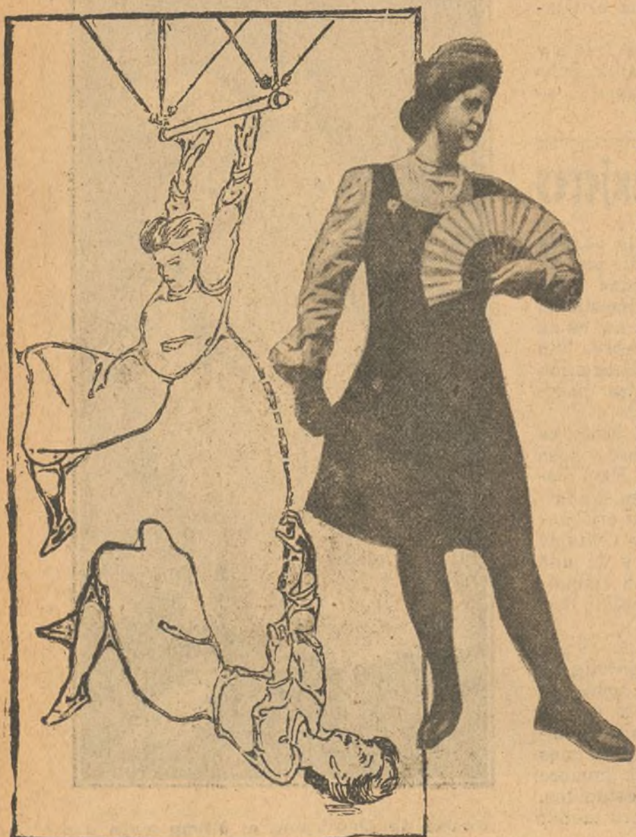
Dramática muerte de una señorita, haciendo gimnasia

Las ilustraciones que publicamos dan idea de la preparación del explosivo en las cartas. Sobre el plegado previo del papel se extiende cuidadosamente el fulminato, hasta formar una pasta; se pega luego el detonador con goma por sus bordes y se introduce con exquisito cuidado en el sobre.