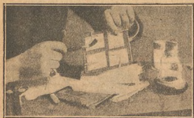
Operación de pegar el fulminato

El procedimiento para estos criminales atentados es el fulminato de mercurio, que se emplea, sin embargo, poco en relación con el uso que se hace de la pólvora negra y la dinamita, a causa de que aquel es muy peligroso para el que no es un químico o tiene buena práctica de combinaciones químicas.