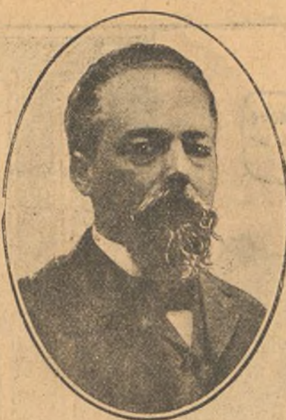
M. Doumer Candidatos principales a la Presidencia de la República Francesa, que han sido derrotados.

La costumbre de cruzar las manos y los pies es otra señal de locura.