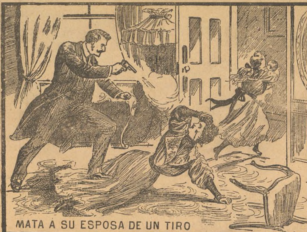
MATA A SU ESPOSA DE UN TIRO

No hay que decir la enorme sensación que produciría tal cúmulo de crímenes perpetrados por una sola persona que había tenido hasta entonces fama de hombre prudente. (Di- buio del "Police News".)