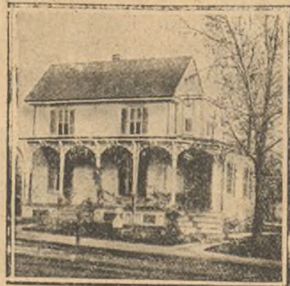
Casa heredada por el caballo Bill.

mundo, y sus nombres pasarán á la posteridad como los de otros tantos Cresos de sus respectivas razas.