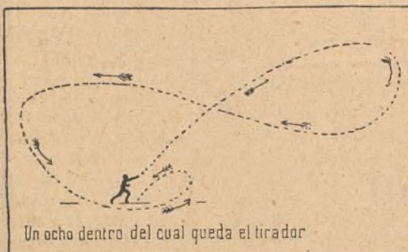
Un ocho dentro del cual queda el tirador

Es una especie de bastón de madera muy dura y resistente, á lo más de cuatro pies de largo, que afecta la forma de una hoz.