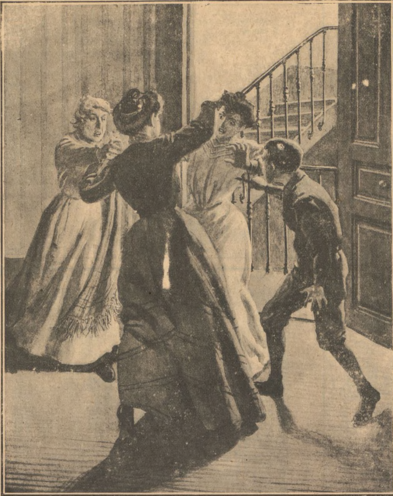
Asesinato de una peñadora por un niño de doce años en Granada.

Por orden del Juzgado se le condujo á la cárcel, hasta que el sumario aclare los detalles del crimen.