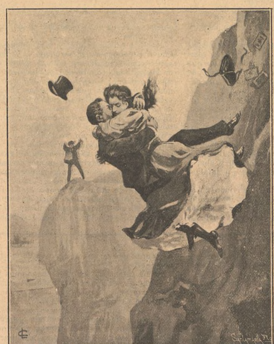
Trágica muerte de dos enamorados que se arrojan por un precipicio.

ferrocarril a última hora de la tarde del día, quedando allí depositado el cadáver en una capilla ardiente, hasta las diez de la mañana siguiente que fué conducido al Cementerio Nuevo de Montjuich, donde recibió cristiana sepultura.