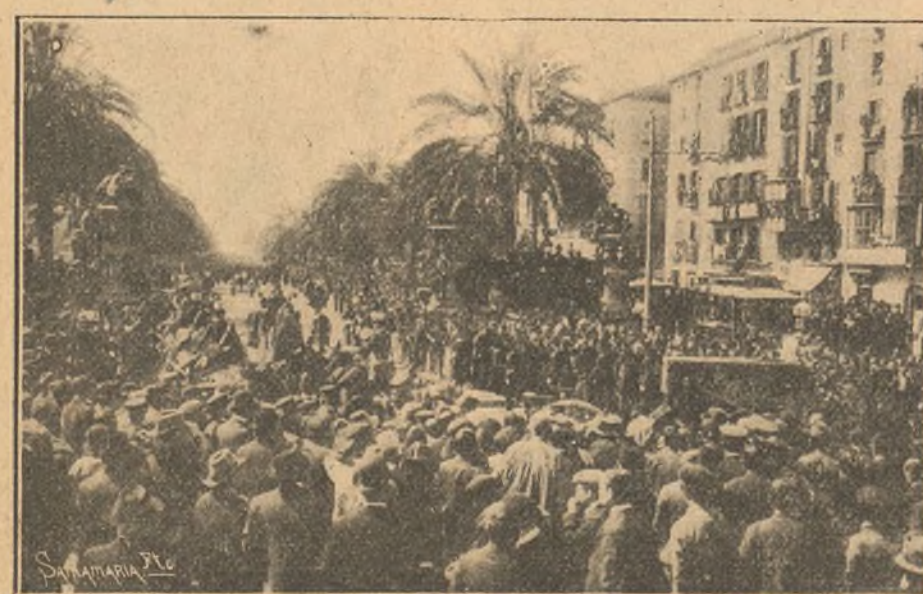
El entierro del general Blanco a su tránsito por el paseo Colón de Barcelona.

"Una de las lanchas en que iban soldados de Marina y una música zozobró, yendo todos al agua, pero siendo recogidos inmediatamente."