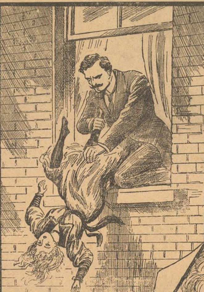
ARROJA Á SU HIJA DE CABEZA A LA CALLE