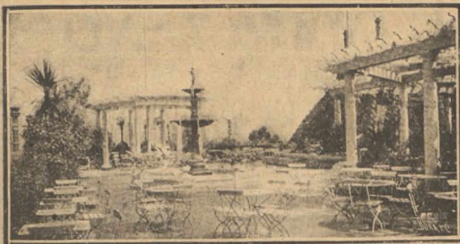
Magnífico jardín sobre el techo de un hotel en Nueva York.