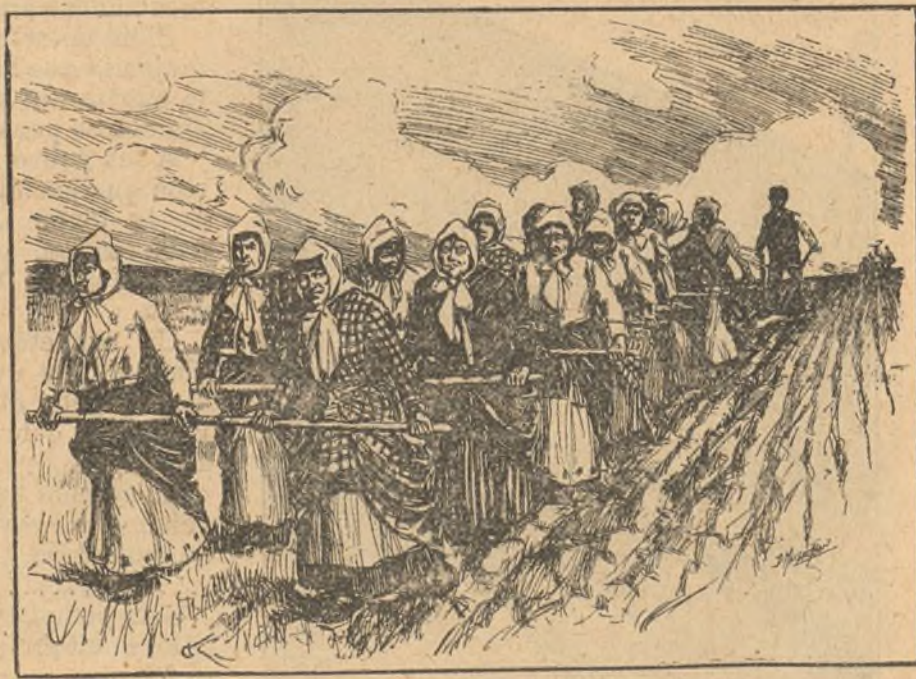
Las mujeres sustituyen á los animales para tirar del arado en algunas poblaciones rusas.

El dinero que gasta en beber el pueblo alemán, representa tres veces el coste de su ejército y armada y más de siete veces la cantidad que se dedica á instrucción primaria. Su importe es casi igual al de la Deuda nacional de aquel país; y si el pueblo alemán se resignara á no beber durante un año y un mes, podría pagar hasta el último céntimo de aquella.