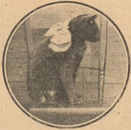
Blackie, gato dueño del piso de una casa.

De esta comisión forman parte varias personas que pertenecen á la Sociedad Protectora de Animales y desempeñan su cometido con verdadero entusiasmo.