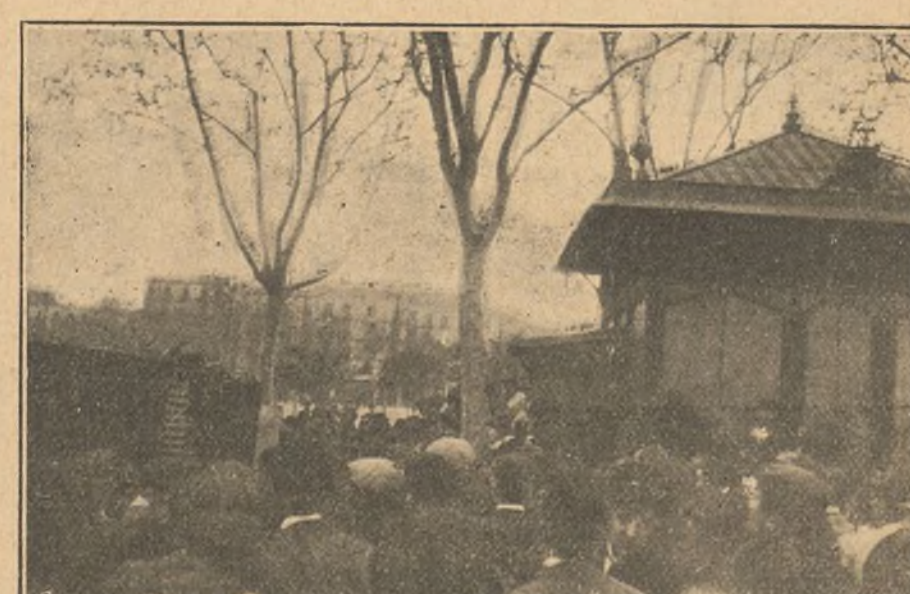
Suicidio de una señorita en Barcelona.—El público contemplando la traslación del cadáver. (Fot. Castella).

Entre los animales se dan casos frecuentes de infanticidio, parricidio y fratricidio. Los asaltos y atentados a la vida de sus semejantes por antipatía invencible son numerosos: caballos, perros y monos, facilitan casos constantes.