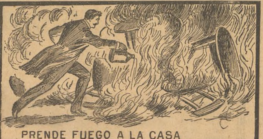
PRENDE FUEGO A LA CASA