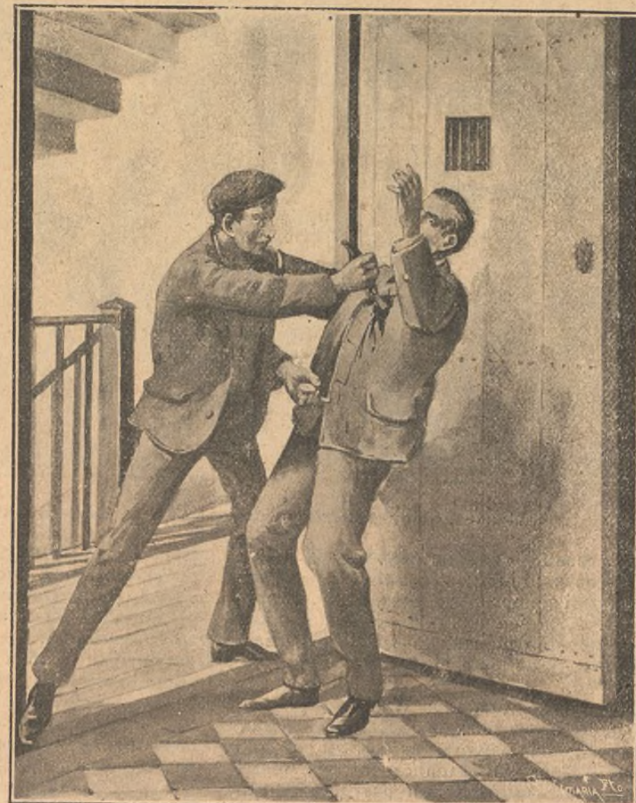
Concejal asesinado en Abanto por haber impuesto una multa.