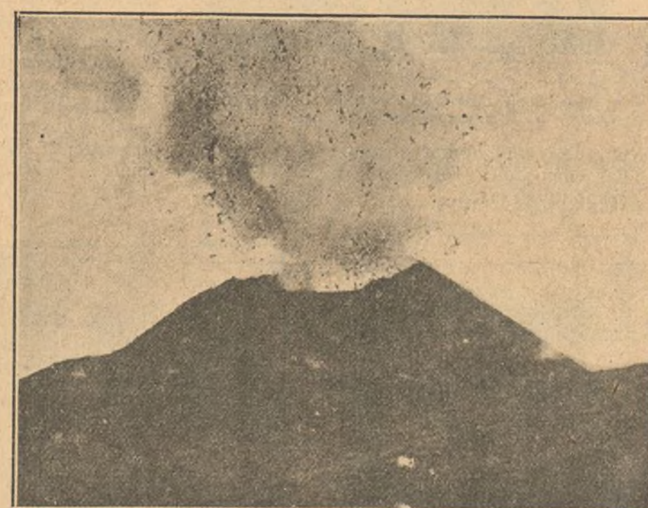
Fotografía del cráter del Vesubio, cuya actual erupción ha producido espantosa catástrofe.

El suceso que vamos a contar ha ocurrido