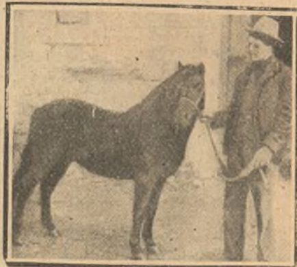
El caballo Bill, que ha heredado una casa.

Estos animales son: un caballo, una vaca y dos gatos.