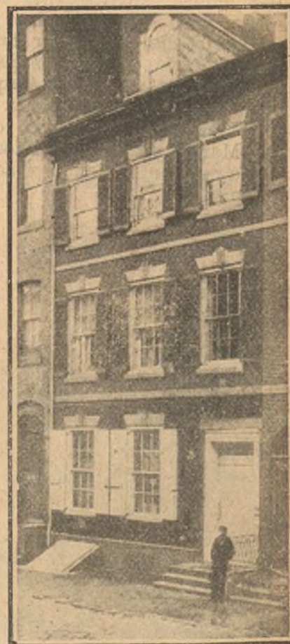
Casa cuyo segundo piso es propiedad de dos gatos.