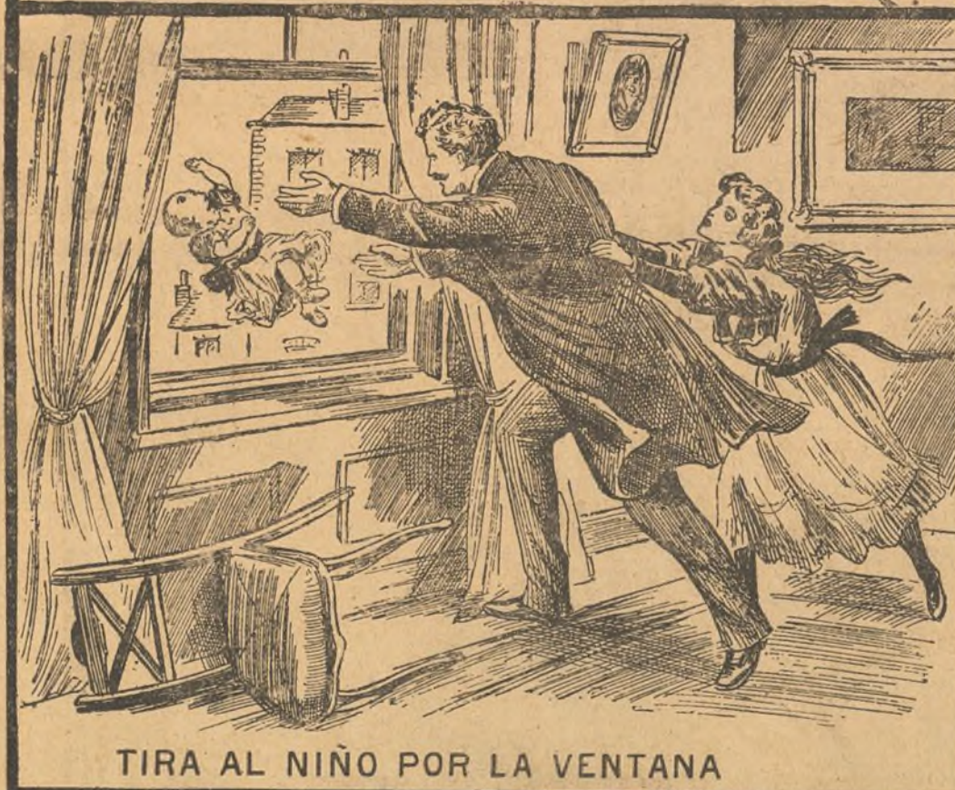
TIRA AL NIÑO POR LA VENTANA