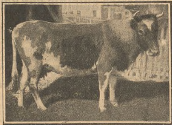
Una vaca que tiene una gran fortuna en el Banco.

En Pensylvania se encuentran los cuatro animales más afortunados que seguramente existen y han existido desde que el mundo es