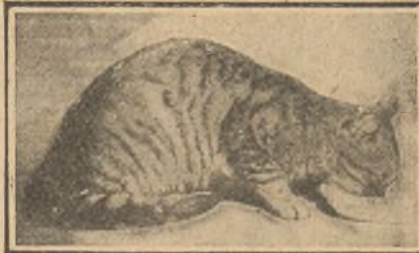
Pinkie, que tiene parte en la utilidad del piso de una casa.