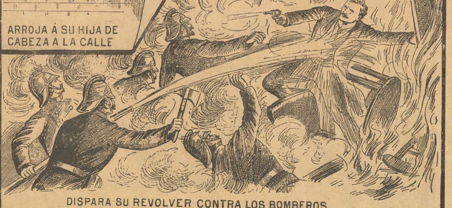
DISPARA SU REVOLVER CONTRA LOS BOMBEROS