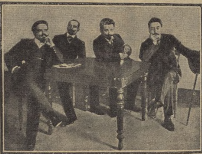
Los diputados republicanos de Lisboa que protestaron del aumento en la lista civil del rey, lo que originó la dictadura y el movimiento revolucionario.

los pensadores, intentando anular las inmunidades parlamentarias.