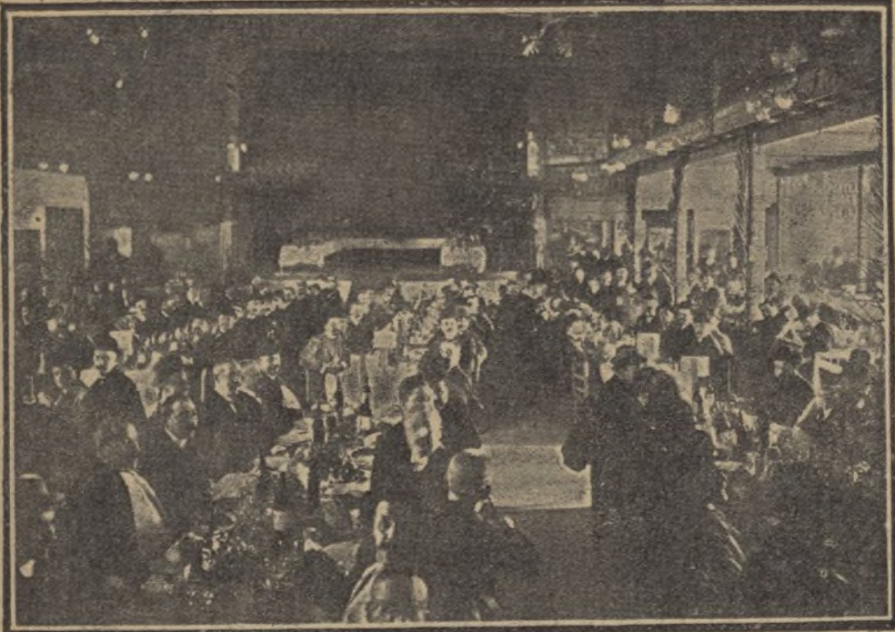
BARCELONA — Banquete celebrado en honor de D. Alberto Rasiñol en el teatro del Bosque.