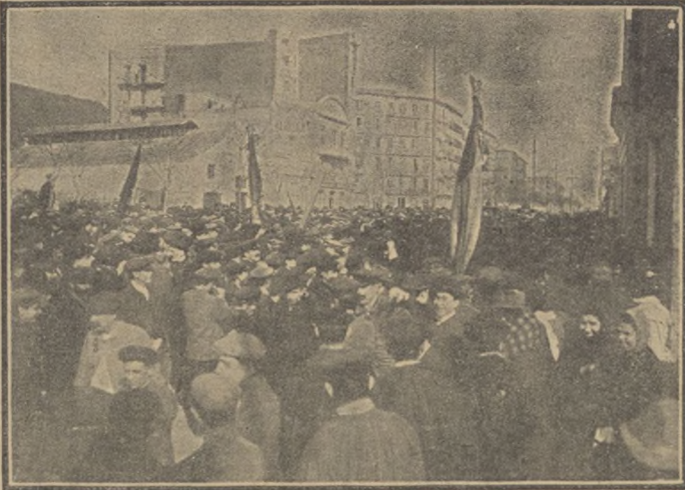
BARCELONA — El público á la salida del mitin Lerrouxista verificado en la casa del Pueblo.

El periódico francés "Le Matin", iniciador de la célebre carrera "Paris-Peking"