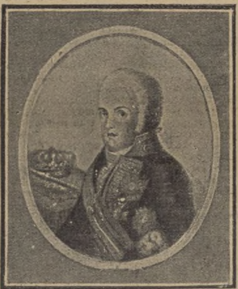
El rey de Portugal Juan VI, que murió envenenado.

Aunque algunos periódicos han asegurado que la conspiración de la que resultó víctima D. Carlos es única en Portugal, nosotros extractaremos algunas páginas de