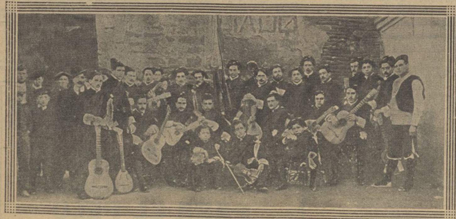
La Tuna Escolar de Zaragoza, que recorre las capitales de provincias para reunir fondos con destino á un "Dispensario antituberculoso".