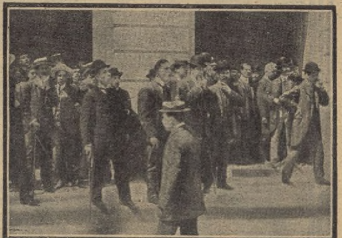
La célebre silba de los estudiantes amotinados contra el presidente Juan Franco cuando se le proclamó dictador.

Este tirano es muy sobrio: no bebe vino,