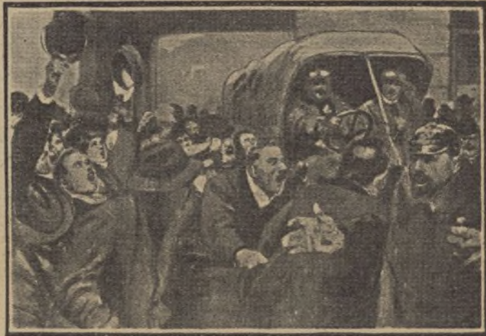
BERLIN — Salida de los automóviles alemanes que van á tomar parte en la carrera Nueva York-París. El público vi-torizando á los automovilistas. (Del "Die Voche").