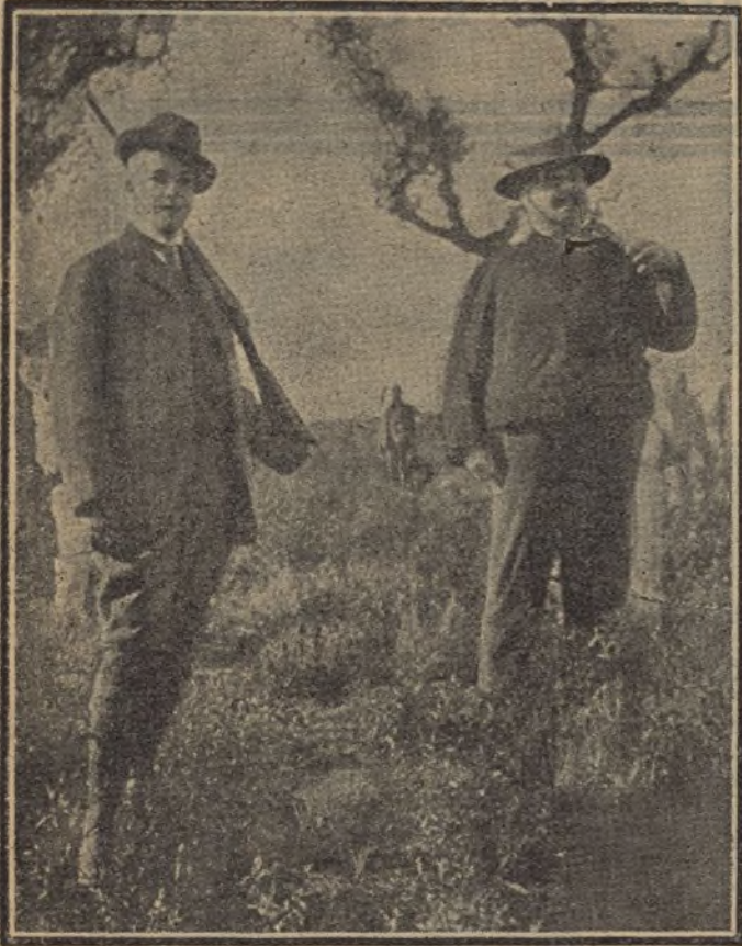
El rey de Portugal y el príncipe heredero. — Fotografía hecha en Villaviciosa durante la última cacería, horas antes de que los monarcas fuesen asesinados.

Cuéntase también que fue un día riguroso de la segunda quincena de Febrero de 1855 cuando se bautizó a Franco.