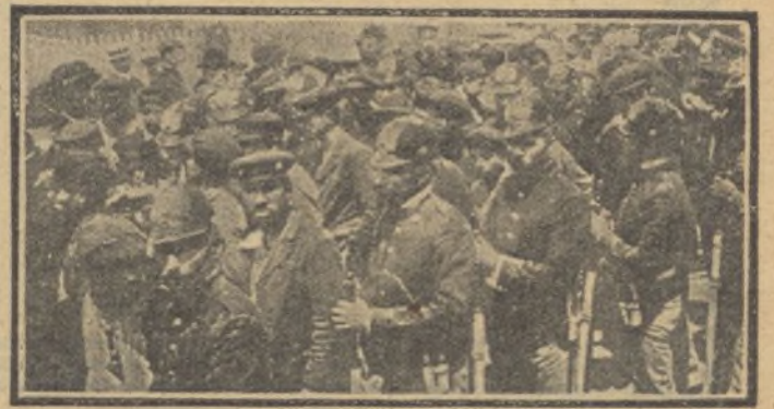
Presos políticos vigilados por la tropa para ser conducidos a la deportación en las colonias portuguesas en África.