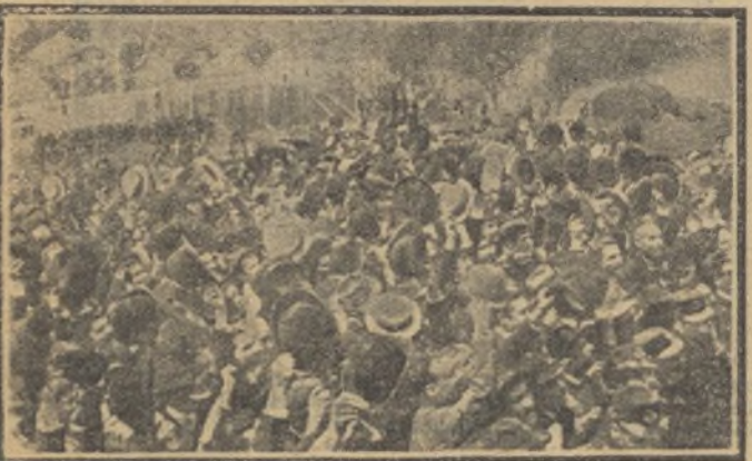
Manifestación entusiasta y homenaje de simpatía que se tributó a Bernardino Machado, jefe de los republicanos.