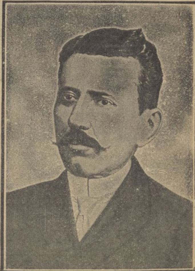
Juan Franco, el presidente del Consejo de ministros de Portugal, a cuya dictadura se debe el movimiento revolucionario, de tan trágicas consecuencias.

EL PRÍNCIPE — El joven príncipe que tan trágica muerte ha tenido, D. Luis Felipe María Carlos Amelio, duque de Braganza, nació en Lisboa el 21 de Marzo de 1887; iba, pues, a cumplir veintidós años. Era muy inteligente, y en su rostro llevaba más el sello de los Orleans que el de los Braganza.