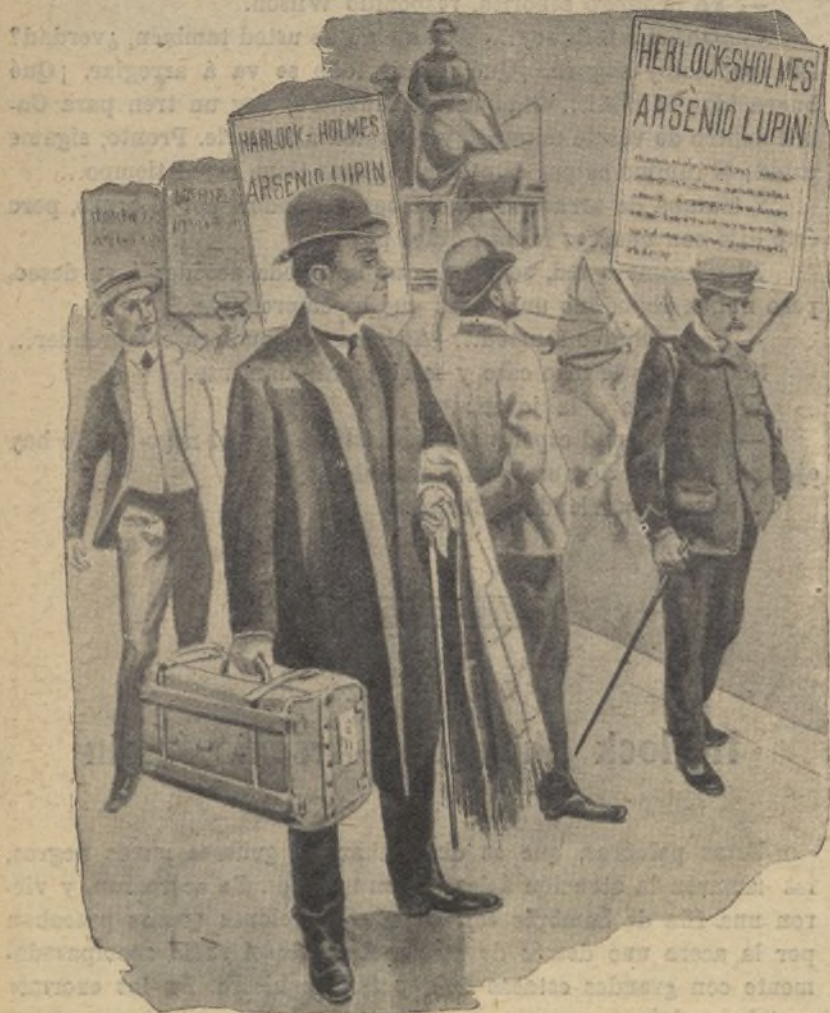
Se acercaron, y vieron una jua de hombres con grandes cartones

— Oiga usted, Herlock, nosotros nos jactábamos de traba-