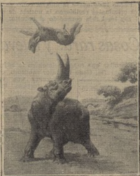
Reconstitución exacta del monstruo ya desaparecido de la tierra

*** Según aseguran los que le conocen in-