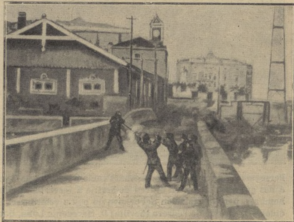
Carabinero que dispara y mata á un sargento. — Reconstitución del crimen en el sitio exacto de la estación de Portugalete y la vía

Otro antecedente de que se habla, es la idiotez de su hijo.