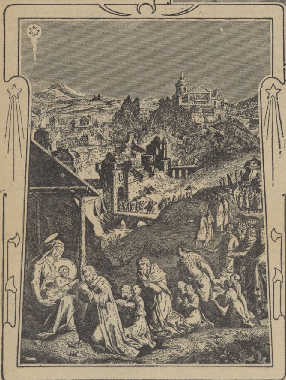
La adoración de los reyes magos que acudieron á Belén, según la tradición cristiana, guiados por una estrella misteriosa (Reproducción de una estampa antigua)

ciudad hasta Belén, donde "se detuvo" justamente encima de la humilde choza dentro de la cual el niño Jesús dormía en los brazos de su madre, la Virgen María. Fundan los astrónomos su suposición en el he-