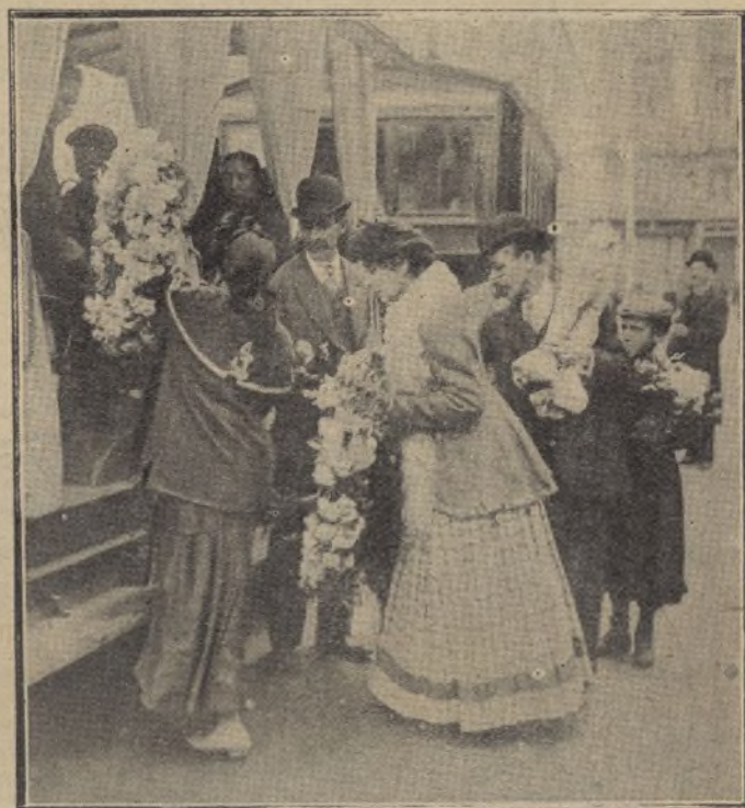
El público tomando los tranvías para dirigirse al cementerio en la festividad del domingo último

Así es que los guardias han recibido órdenes terminantes de que, cuando vean alguna señora barriendo el suelo con sus largas faldas, la impongan una multa sin miramientos de ningún género, y caso de que