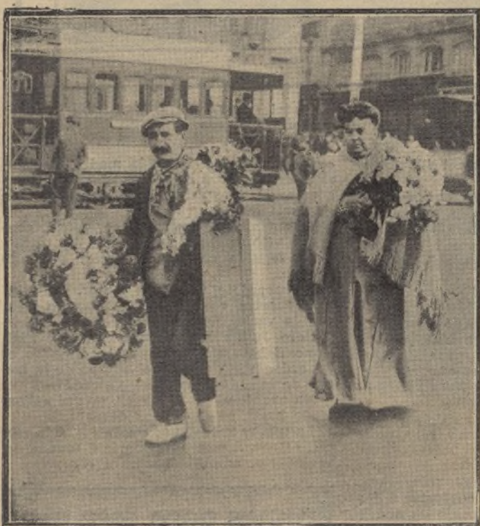
Camino del cementerio. — Una pareja que conduce flores y coronas para depositar sobre la tumba de sus muertos

su aeroplano un sorprendente viaje aéreo, casi en línea recta, desde su hangar situado en el campo de Chalons a la ciudad de Reims.