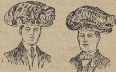
Gorros llevando los emblemas de los republicanos y de los demócratas, que se utilizan como propaganda electoral en los Estados Unidos.

Al día siguiente, se vió la misma extraña procesión, pero compuesta por otros jóvenes llevando gorras semejantes, con la diferencia de que el animal en relieve era un tigre, emblema de los demócratas.