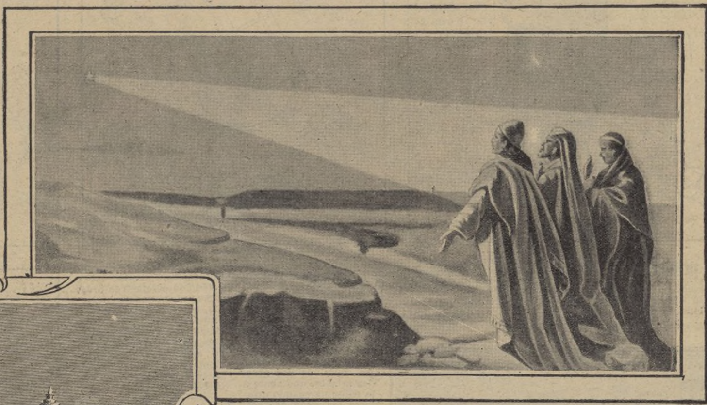
La estrella que orientó a los reyes magos, ó sea el cometa de Halley vuelve otra vez este año, á verse desde la Tierra

Los astrónomos de todo el mundo dirigen desde hace algunos meses, sus telescopios hacia una determinada parte del firmamento, con la esperanza de ser cada uno de ellos el primero en dar la bienvenida a un celestial viajero, que ha permanecido ausente durante 76 años y que en la actualidad se aproxima de nuevo a la Tierra. Y con razón muéstranse conmovidos los astrónomos ante la proximidad del visitante; su alcurnia y su renombre le hacen digno del interés de todos, tanto de los sabios como del vulgo. Los hombres de ciencia conocen a ese viajero celeste con el nombre de Cometa de Halley , por ser este famoso astrónomo, colega de Newton, quien por primera vez lo estudió el año 1682, pero la gente que sabe poco de astronomía viene llamándole desde el año 4, antes de Jesucristo, la Estrella de Belén . Supónese, en efecto, que el Cometa de Halley es el que se apareció en el Oriente, y guió a los Reyes Magos hasta Jerusalén y desde esta