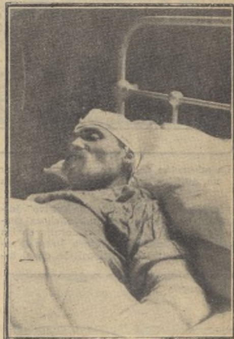
Cabo de seguridad herido por un toro que saltó la barrera en la plaza de Barcelona