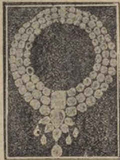
Collar de brillantes que valen una fortuna. La piedra cuadrada del centro se conoce con el nombre de "Estrella del Este".

tas. A este soberbio brillante se le denomina "la estrella del Este", y es uno de los más puros que existen en el mundo. Pertenece el collar a un príncipe indio, súbdito del rey de Inglaterra. El título oficial de este príncipe es "Gaekwar de Barodo", lo que quiere decir, literalmente, "el pastor de las vacas". La riqueza del príncipe es inmensa, y alcanza una respetable cifra de millones.