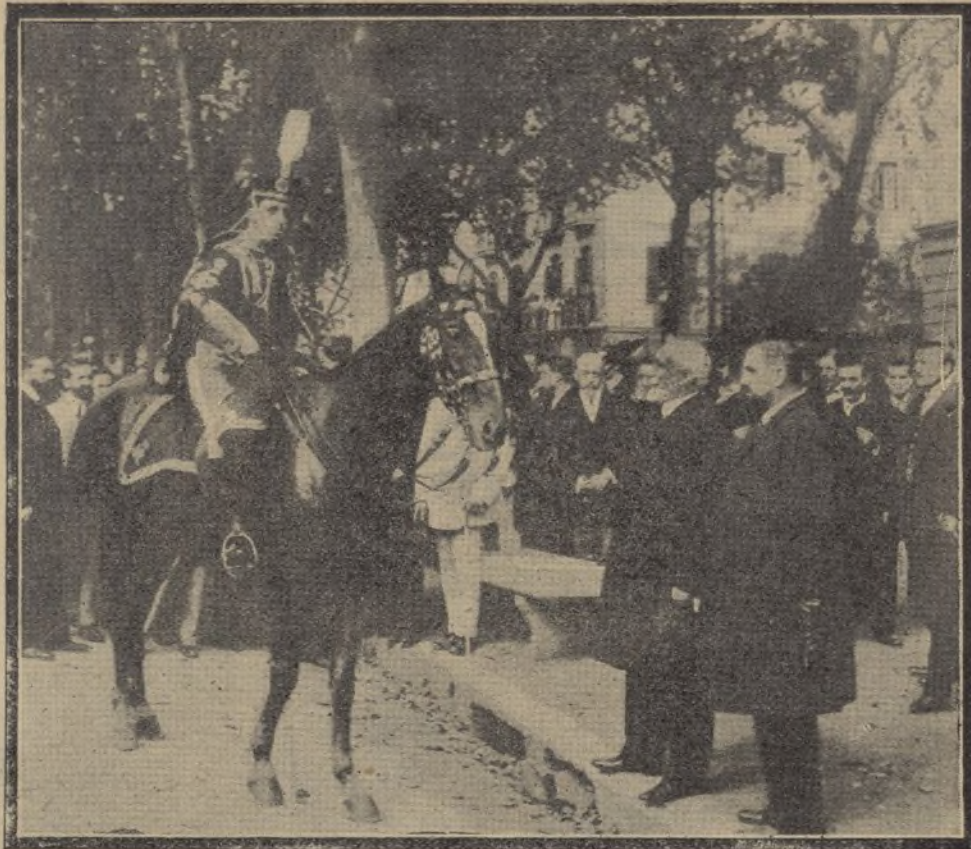
El rey, después de la revista militar, conversando con el Sr. Maura y gobernador civil de Barcelona

El general Linares ha publicado una orden general, en que dice: "Su majestad el rey me ha hecho repetidos elogios de las tropas que han concurrido á la gran parada, y me complace en hacerlos públicos para satisfacción de todos."