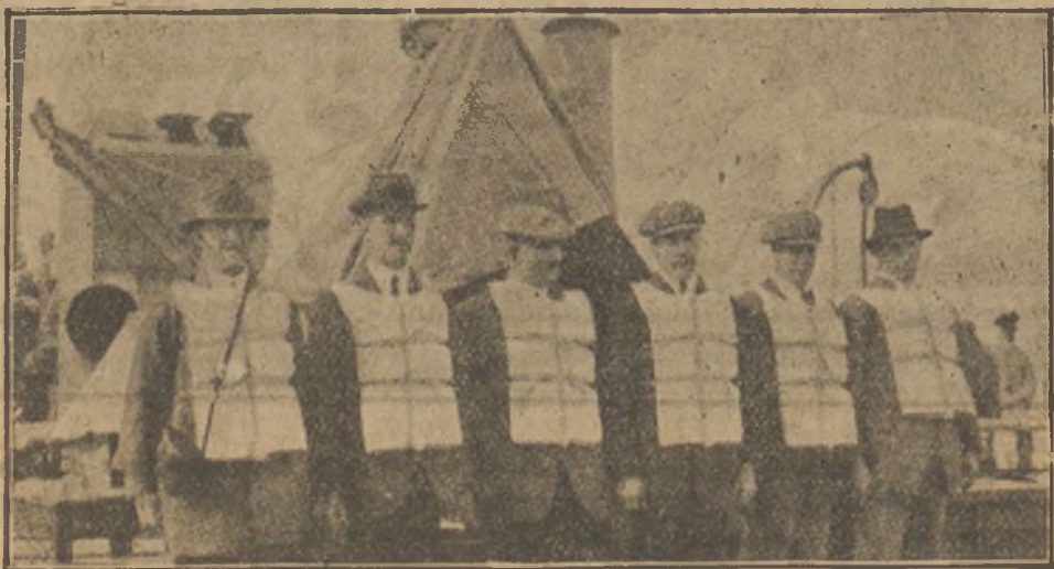
El miedo á los submarinos. Pasajeros de un vapor haciendo ensayos con los salvavidas por temor á los ataques alemanes.

«Los que suscriben, como presidentes y representantes de las industrias que tienen por base la tracción de sangre y tracción mecánica, con domicilio en esta corte, á V. E. respetuosamente exponen: