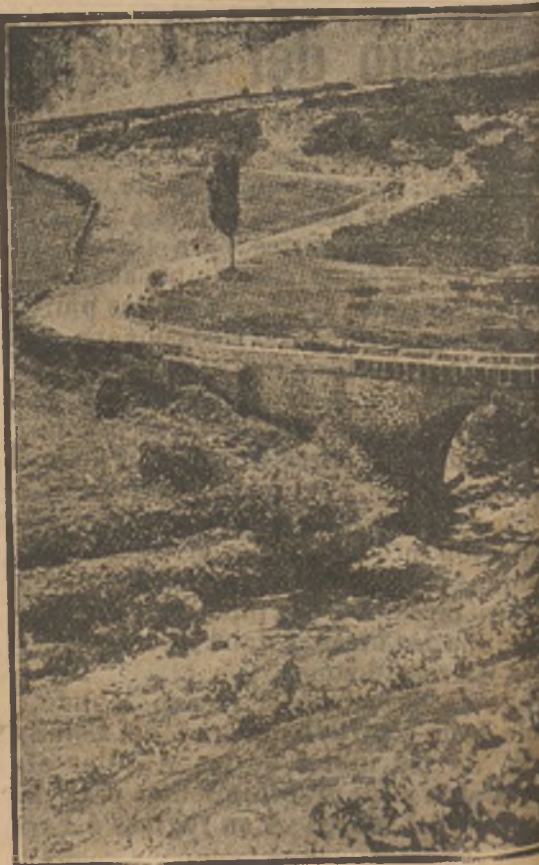
Uno de los tristemente célebres puentes de la muerte en la Sierra del Guadarrama.

No pienses mucho en ti mismo, porque hablarías demasiado de tus propios méritos; ni hables de tus deméritos sin necesidad, pero conócelos para que puedas corregirlos.