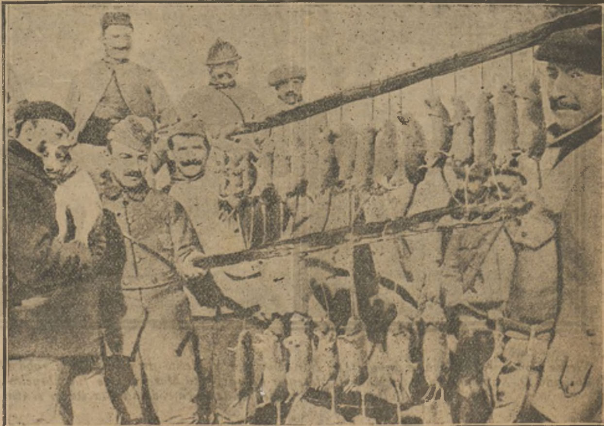
Los enemigos del soldado en las trincheras. Docenas de ratas cazadas en quince minutos y por un perro ratonero en las líneas francesas.

anunciada en Tetuín en la que hubieran lidiado Cocherito de Madrid, Cantaritos y Torquito III.