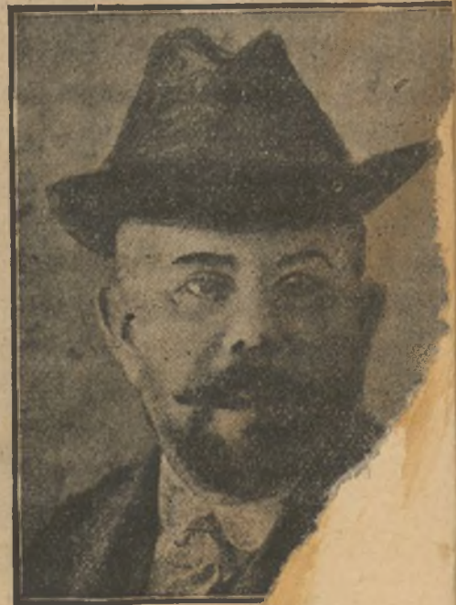
El crítico militar decidido gorma su firma

por una cuerda y espera; las ranas atraídas por la luz vienen á instalarse en la madeja, entonces no le queda más que sacar lentamente la plancha del agua y agarrar las ranas y echarlas á un saco.