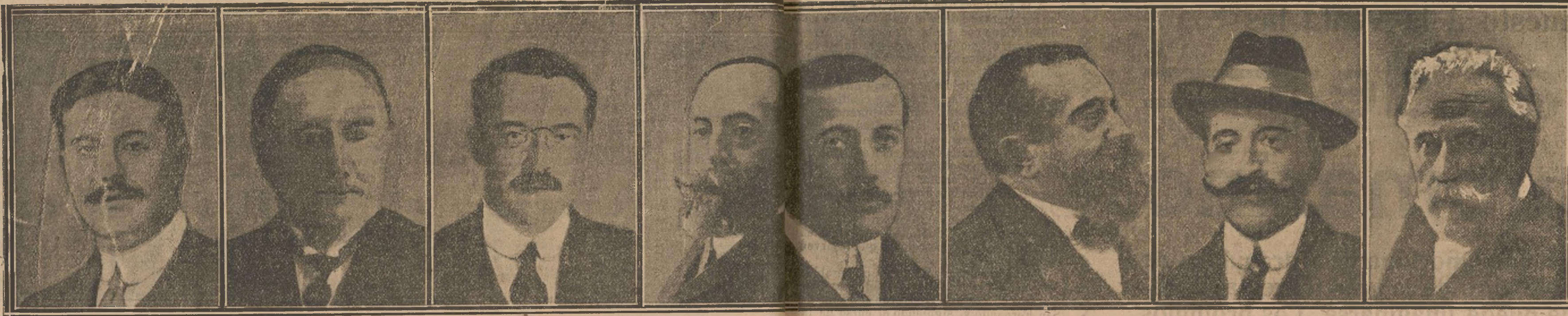
Conde de Santa Engracia.

Un dato curioso es cómo se realiza la correspondencia con esta isla. La correspondencia, envuelta en un saco de cuero impermeable se echa al mar y la corriente se encarga de llevarla a la playa de la isla. Pero este sistema es imperfecto hasta más no poder, y los habitantes en la actualidad aun esperan noticias de la Navidad.