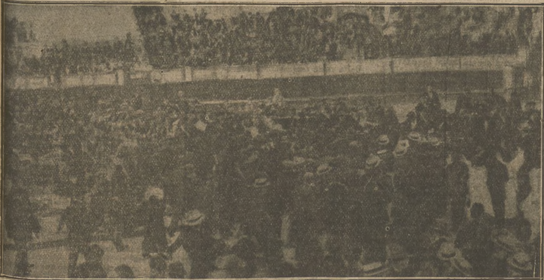
Hundimiento de un tablado en la Plaza de Toros, cuando iba a cantar el gran orfeón Donostiarra. Aspecto del redondel, cuando el público auxiliaba a las víctimas.

Las causas del accidente parece ser que obedecieron a que la plataforma del tablado no tenía maderos o sostenes transversales, y al subir sobre ella el Orfeón no pudo resistir el peso de tanta persona y sobrevino el hundimiento.