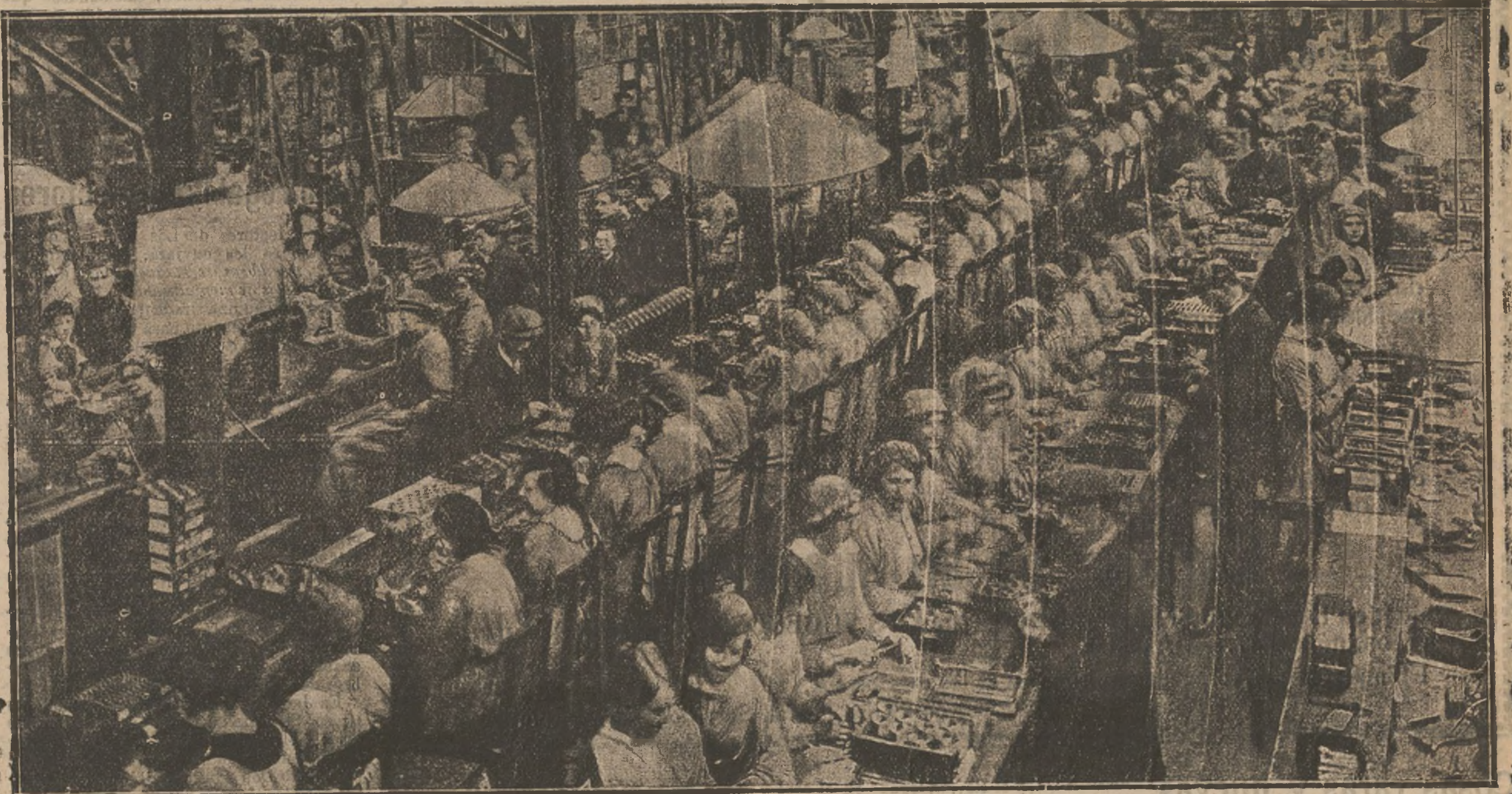
El patriotismo de las mujeres inglesas — Esta interesante fotografía muestra la nave inmensa de una gran fábrica de municiones. Las damas de todas las condiciones sociales, jóvenes y viejas, trabajan febrilmente, sin más estímulo que el de ayudar a los soldados en lucha para que acabe pronto la guerra. Se ha dicho, con razón, que una acción rápida sólo podrá ejercerla el que cuente con mucha artillería y muchos proyectiles.

bien pintoresco de lo que fué y de lo que es la «vergüenza torera».