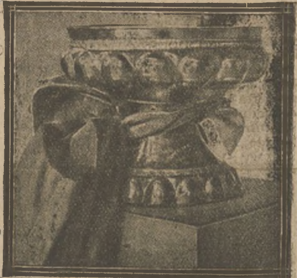
Copa de oro que regalan al gran maestro Granados los artistas de Nueva York y que formaba parte del equipaje del célebre músico desaparecido en el torpedeamiento del «Sussex».

Un joyero de Sevilla, víctima de un robo, ofreció una cantidad á quien descubriera el paradero de las joyas que le habían ro-