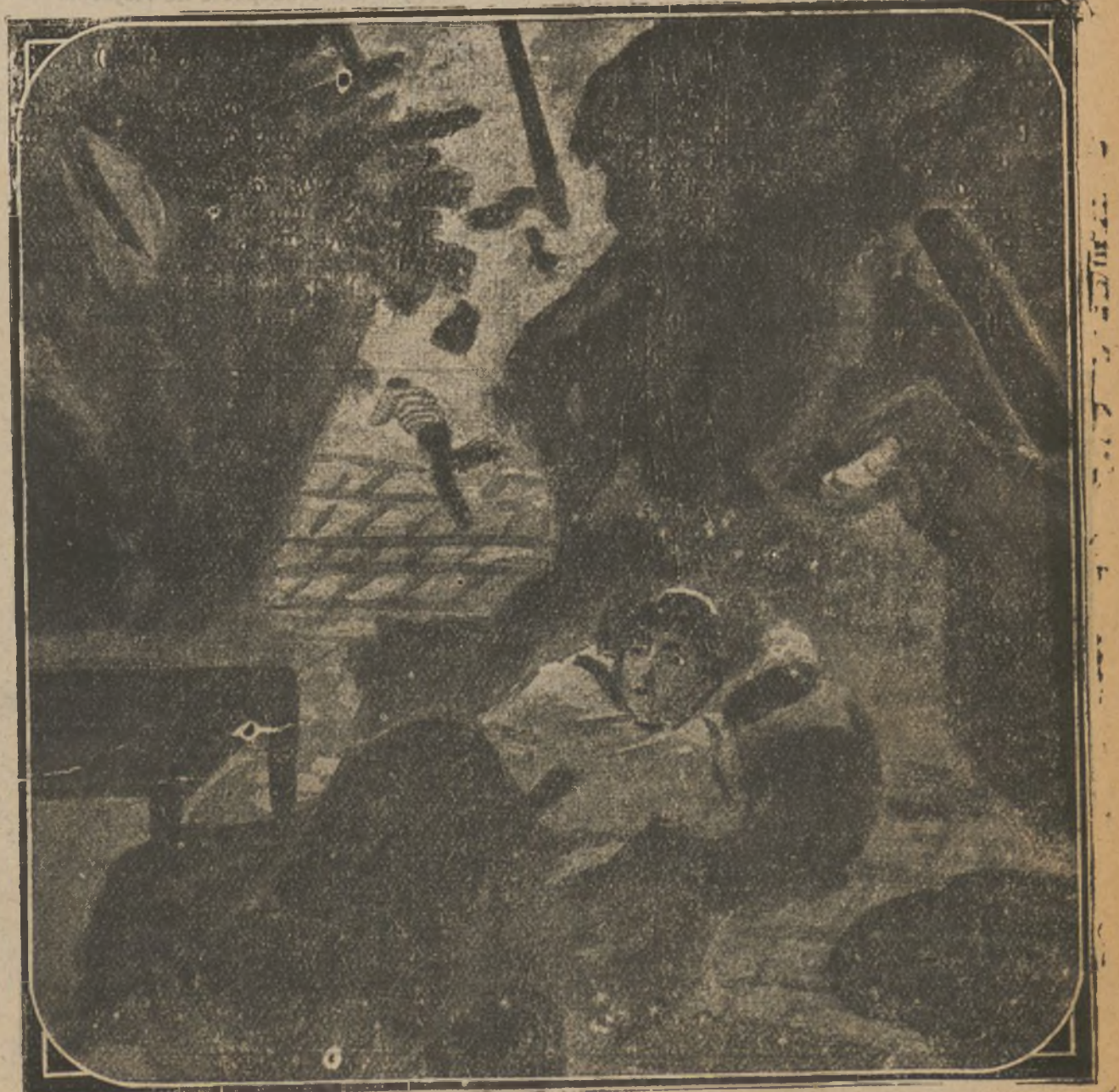
Trágico hundimiento de una casa en Valladolid. Se extrajo muerto de los escombros a un niño de tres meses y gravemente magullada a Pilar Gutiérrez, de treinta y cinco años.