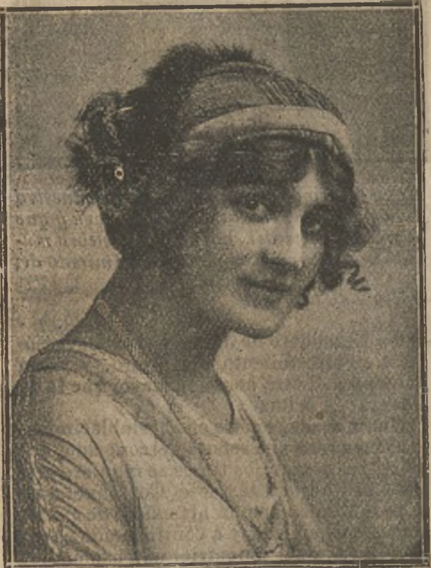
Miss Lily Elsie, gran artista inglesa y bella mujer, que presta heroicos servicios, en la Cruz Roja, a los heridos de la guerra.

Compre usted las HAZAÑAS DE UN SUBMARINO. Es el relato más trágico de la guerra europea.