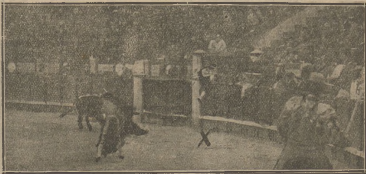
Una «espantá» del Gallo.—Se le ve saltando al callejón lleno de pánico (X), después de un quite, es decir, que hace las huidas en todos los momentos.

Compre usted las HAZAÑAS DE UN SUBMARINO. Es el relato más trágico de la guerra europea.