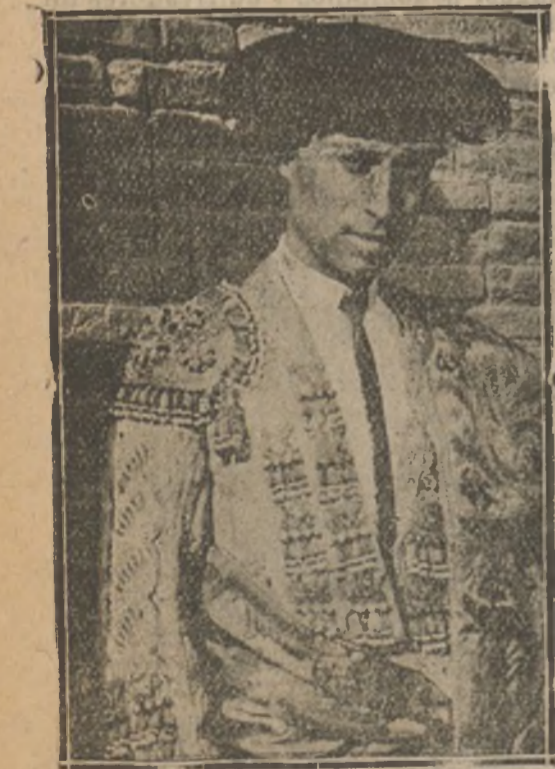
El «Gallo» grande, el pobre torero, ya «sin plumas y cacareando»

«No firmo nada. A beneficio de los pobres torearé siempre que sea necesario. De lo demás, ya veré lo que hago. Hoy por hoy, lo dicho. No firmo nada.»