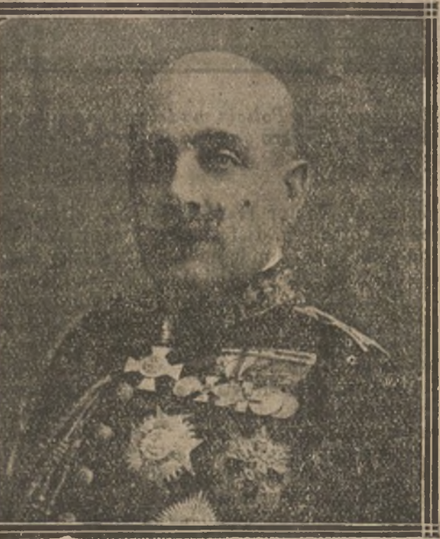
El general Jordana, que tan hábilmente lleva las negociaciones con los merces rebeldes, logrando para España triunfos sin sangre.

No se sabe por qué causa el animal logró romper sus ligaduras, sin que nadie lo advirtiese, y corrió furioso á campo traviesa entrando en las calles de la población.