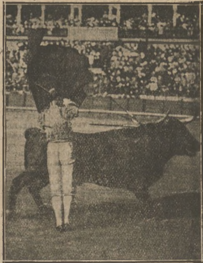
El «Gallo» cuando quiere estar bien... ¡Qué pocas veces!

Si alguno de nuestros lectores es capaz de dar en el blanco con un revólver, tirando desde una distancia de siete metros contra un as de cuadro de una baraja francesa, y por lo menos acierta tres veces por cada cuatro disparos, debe recomendar á sus amigos que no le provoquen mucho, porque