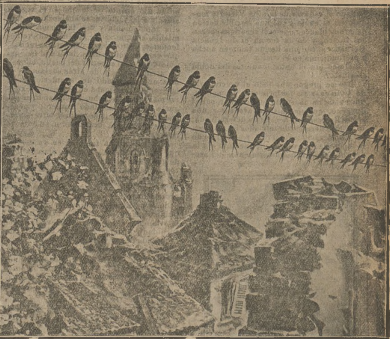
La vida es más fuerte que la guerra y que la muerte. Esta curiosa fotografía, que parece un dibujo alegórico de Alberto Durero ó Feyta, muestra las ruinas de Verdun, donde las golondrinas cuelgan sus nidos y cantan en los cantos de sus amores.

Entre otras importantes obras, ha dejado publicadas las siguientes: «Lecciones sobre la patología comparada de la inflamación», «La inmunidad en las enfermedades infecciosas» y «Estudios sobre la naturaleza humana»; «Ensayo de filosofía optimista».