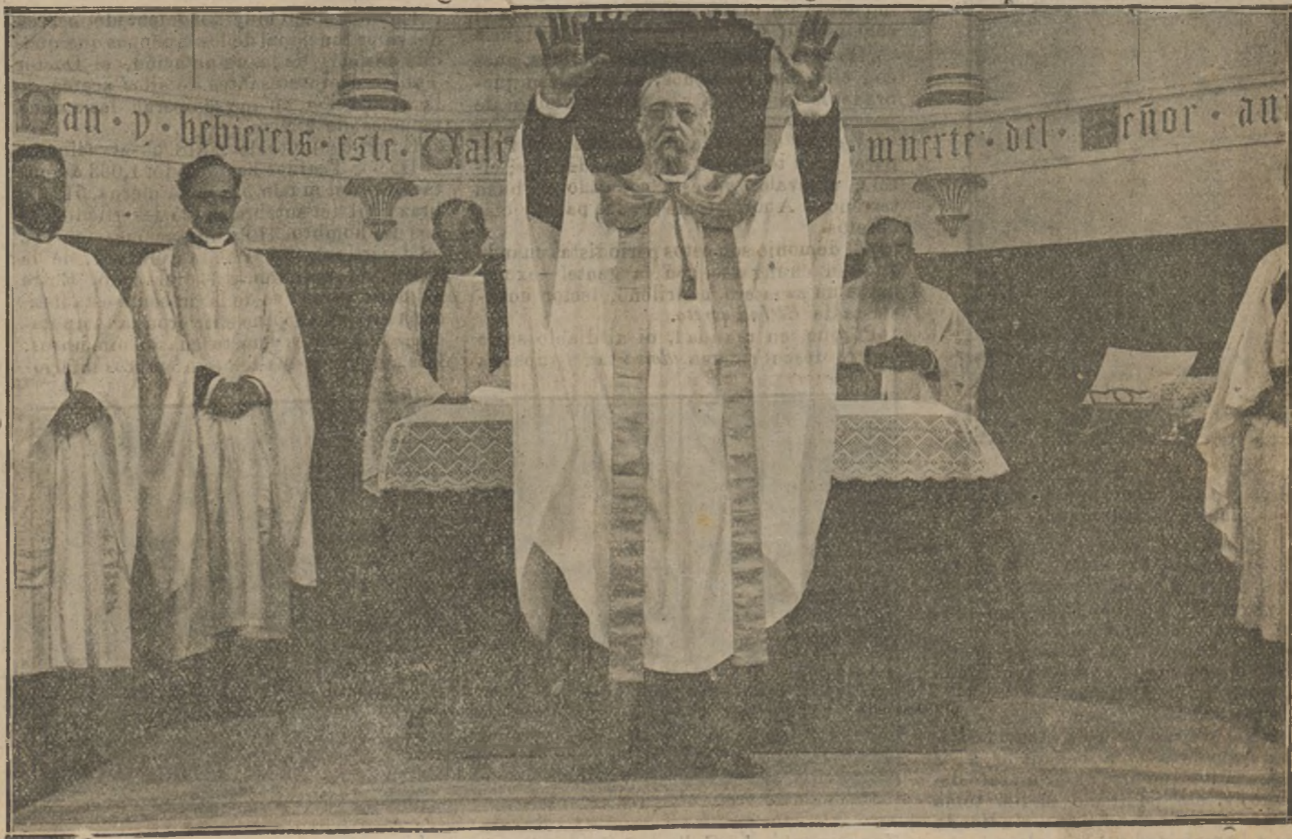
El obispo protestante Sr. Cabrera, fallecido en Madrid la semana última. Está retratado en una ceremonia pública, en la Capilla Evangélica de la calle de Beneficencia.

La Prefectura de Policía de París ha ordenado á todos los Comisarios que adopten medidas contra los adivinos, hechiceros, magos, sonámbulos y cultivadores de la cartomancia, cuyos principales clientes son los deudos y amigos de los soldados en campaña.