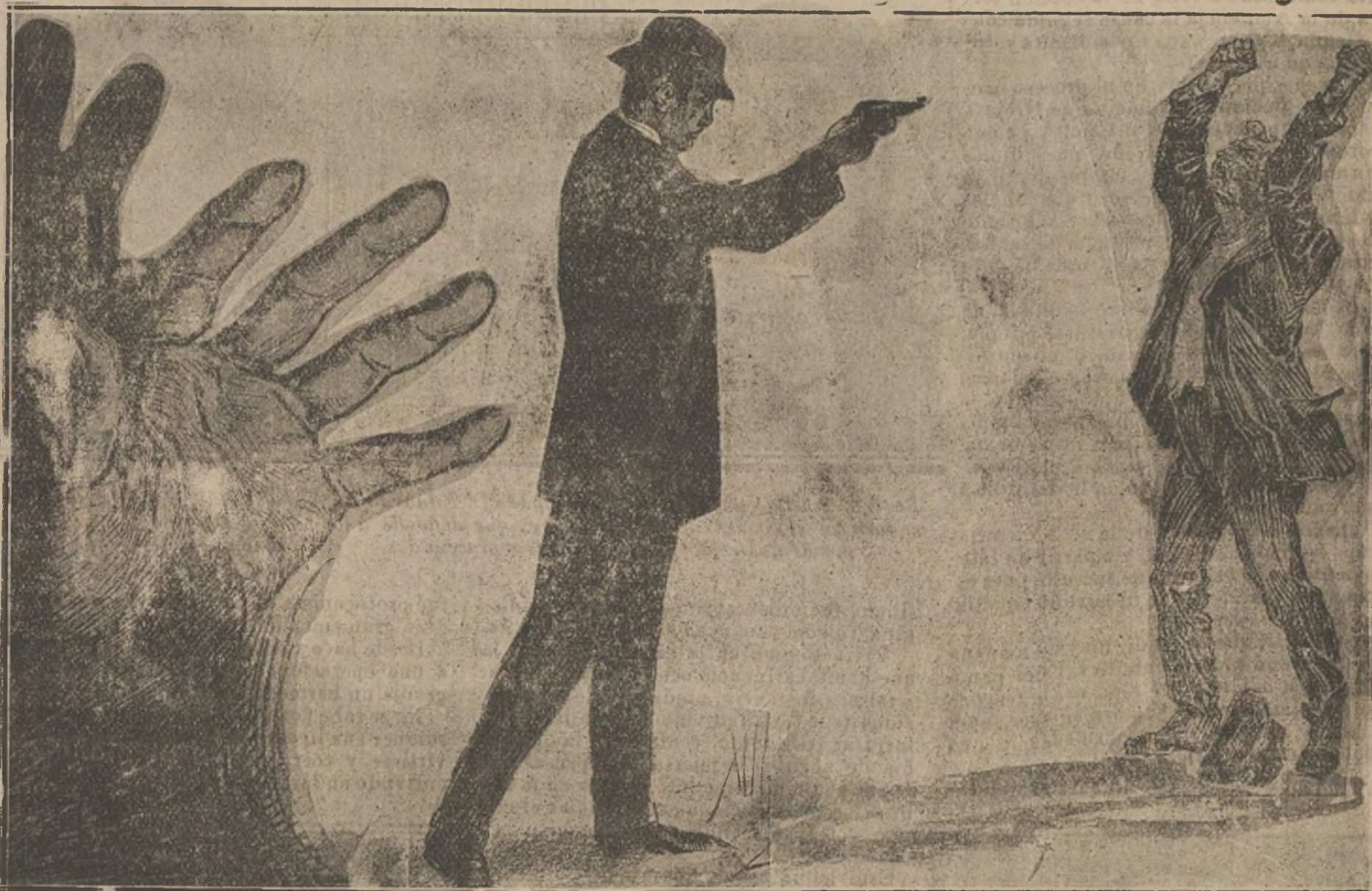
La mano de la Policía madrileña, ha sido esta vez la verdadera «mano que aprieta», sorprendiendo y capturando á los bandidos de la Mancha. Es claro que tan importante servicio se ha hecho con el concurso principal é ineludible de la Benemérita, sin la cual no puede haber paz en el campo ni en las ciudades.

Mientras «la Monitera» y su amante procedían á visitar al hermano de la primera, los policías marcharon en busca de su maestro, hombre terrible, ante el cual todos debían descubrirse. En efecto; los falsos quincalleros vinieron precipitadamente á Madrid y dieron cuenta de sus gestiones al Sr. Maqueda, quien ordenó que fuese con ellos á Valdepeñas el ins-