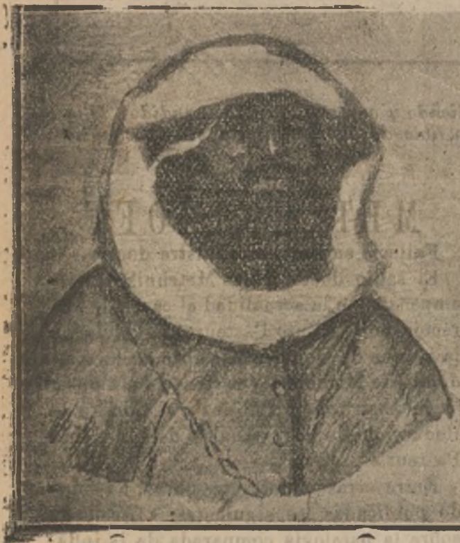
El célebre moro Raisuli que ha celebrado una conferencia con el general Jordana, y lucha ahora en favor de España. ¿Durará mucho su amistad?...

Después de unos años de activísima labor en Sevilla, donde los evangélicos compraron dos templos de exclaustros, vino D. Juan Cabrera á Madrid en 1874, y por unos veinte años regentó la Iglesia del Redentor, que se renia en la calle de la