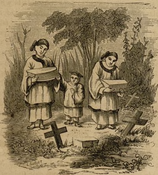
IX.—Religiosas enterrando niños muertos.