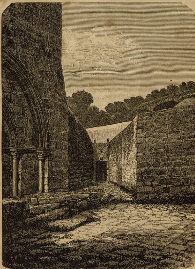
JERUSALEN.—Gruta de la Agonía. (Pág. 142).