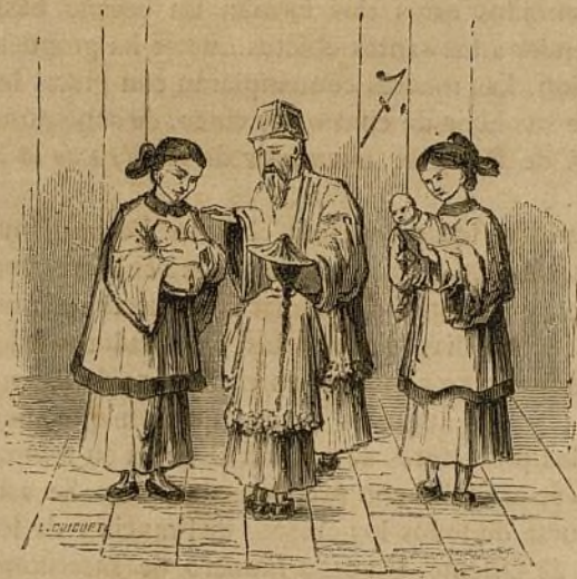
VII.—Misionero supliendo las ceremonias del Bautismo.