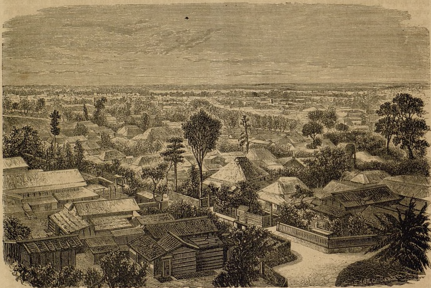
DE HAKODATÉ Á YOKOHAMA.—Vista de Akita por la parte oriental. (Pág. 133).

El día de Pascua se verificó la procesion llamada del encuentro . La misa de Resurreccion se dijo á las cuatro en medio de una afluencia increíble. Despues de la misa se organizó la procesion. Abria la marcha una imagen de María llevada por vírgenes vestidas de blanco, y la cerraba el cortejo del Santísimo Sacramento, que tenia en manos el celebrante. La procesion se dividió en la puerta principal de la Basilica: la santísima Virgen fué por un lado, y por otro el Salvador, con el pensa-