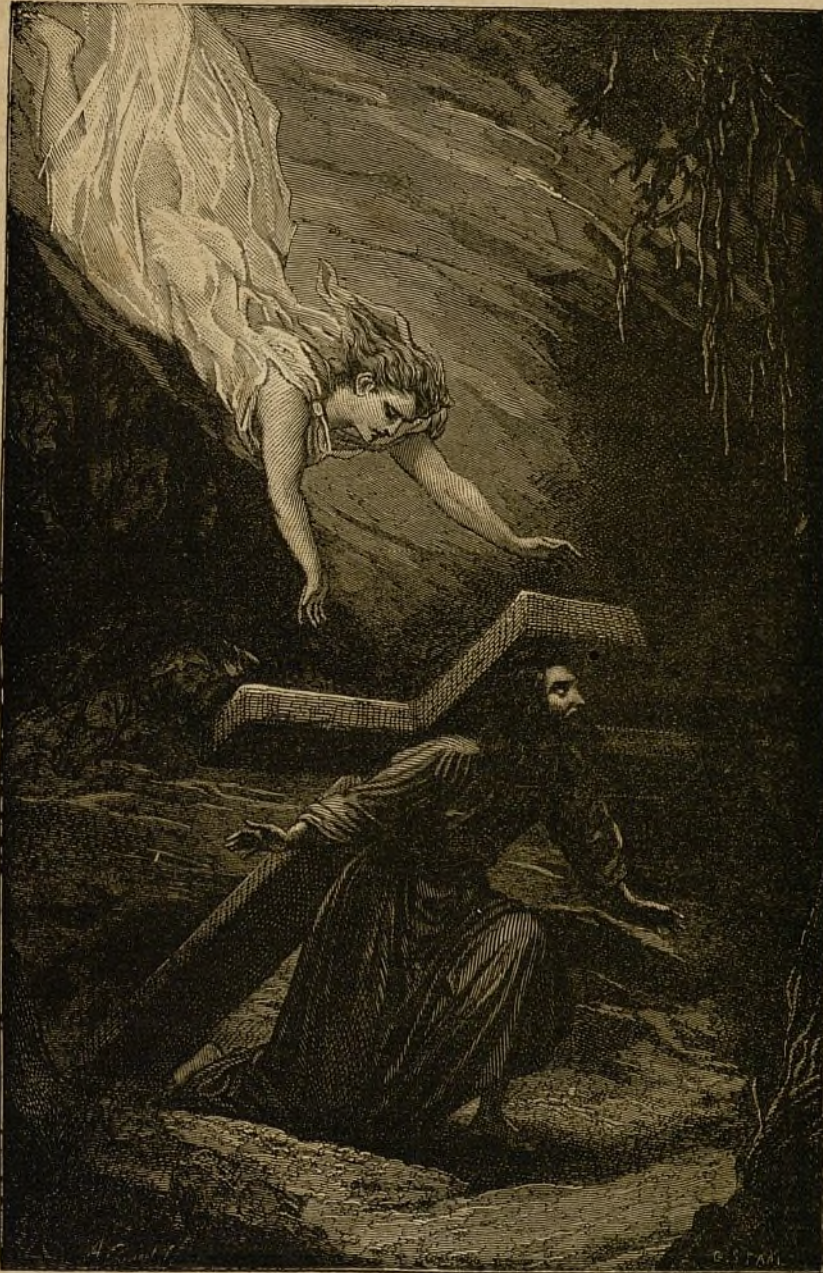
Agonía de Jesús en el huerto de Getsemaní. (Pág. 142).

Por estas razones creen muchos, y nosotros nos adherimos á su opinión, que España debió reclamar la posesión de Mehdía en vez de la quimérica cesión de Santa Cruz de Agadir. ¿Qué es lo que España saca de esta tan ponderada pesquería, que no es ni será nuestra más que en el papel del tratado? Falta imperdonable fué de los