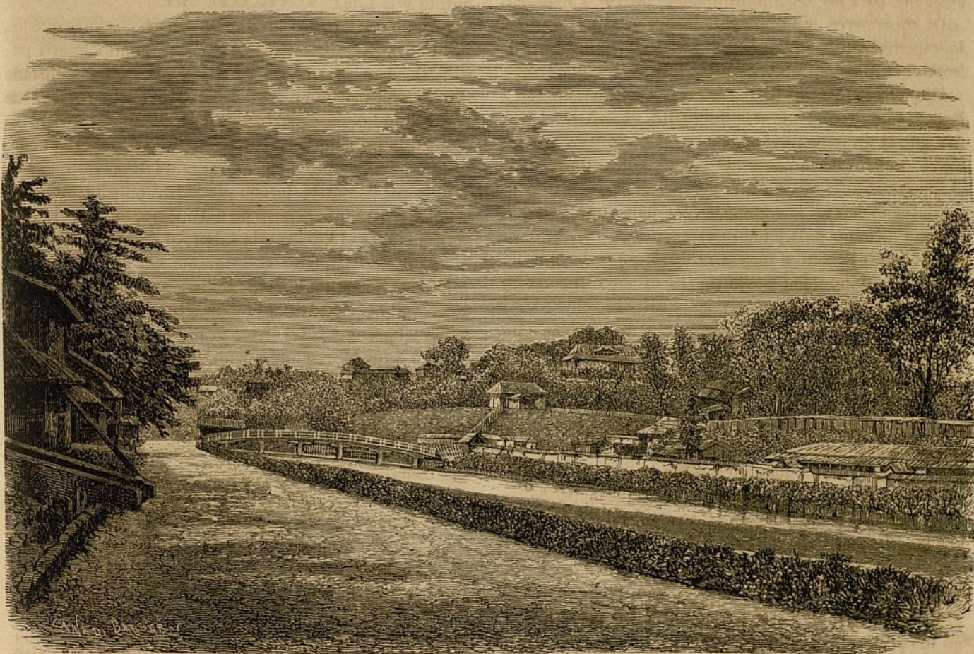
DE HAKODATÉ Á YOKOHAMA.—Fortaleza y fosos de Akita (lado occidental). (Pág. 133).

3.º Al patriarca correspondia el derecho de convocar en concilio á los obispos de su patriarcado.