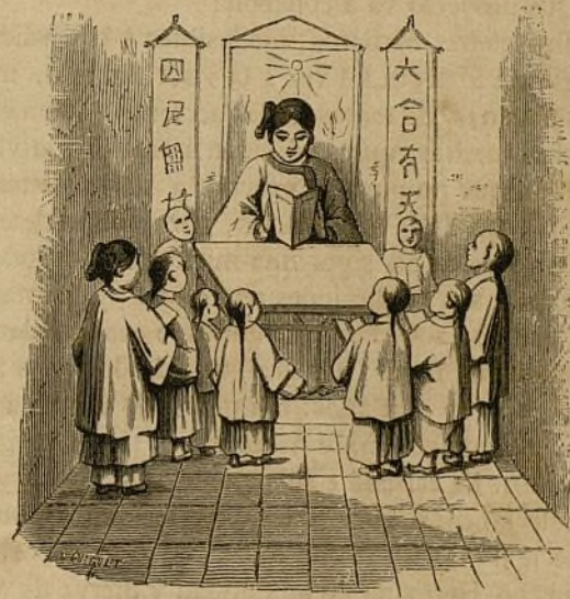
X.—Religiosa instruyendo á los niños.