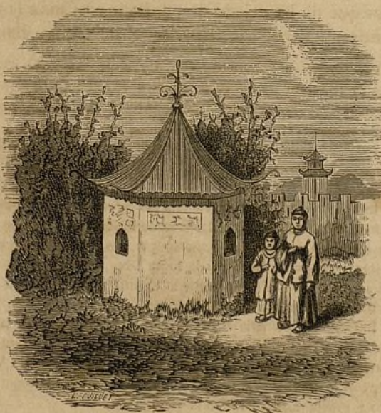
XI.—Torre de los niños (cerca de Shang-hai).