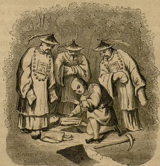
XII.—Niños desenterrados por orden de los mandarines.