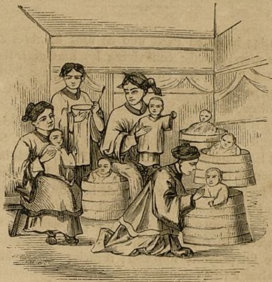
VIII.—Comida de los niños.