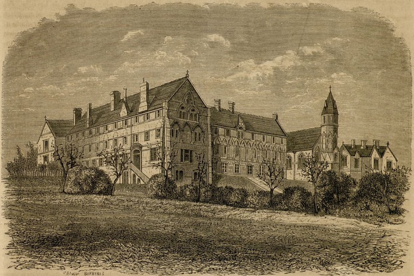
INGLATERRA.—Abadía de Santa Escolástica en Teignmuth. (Pág. 136).