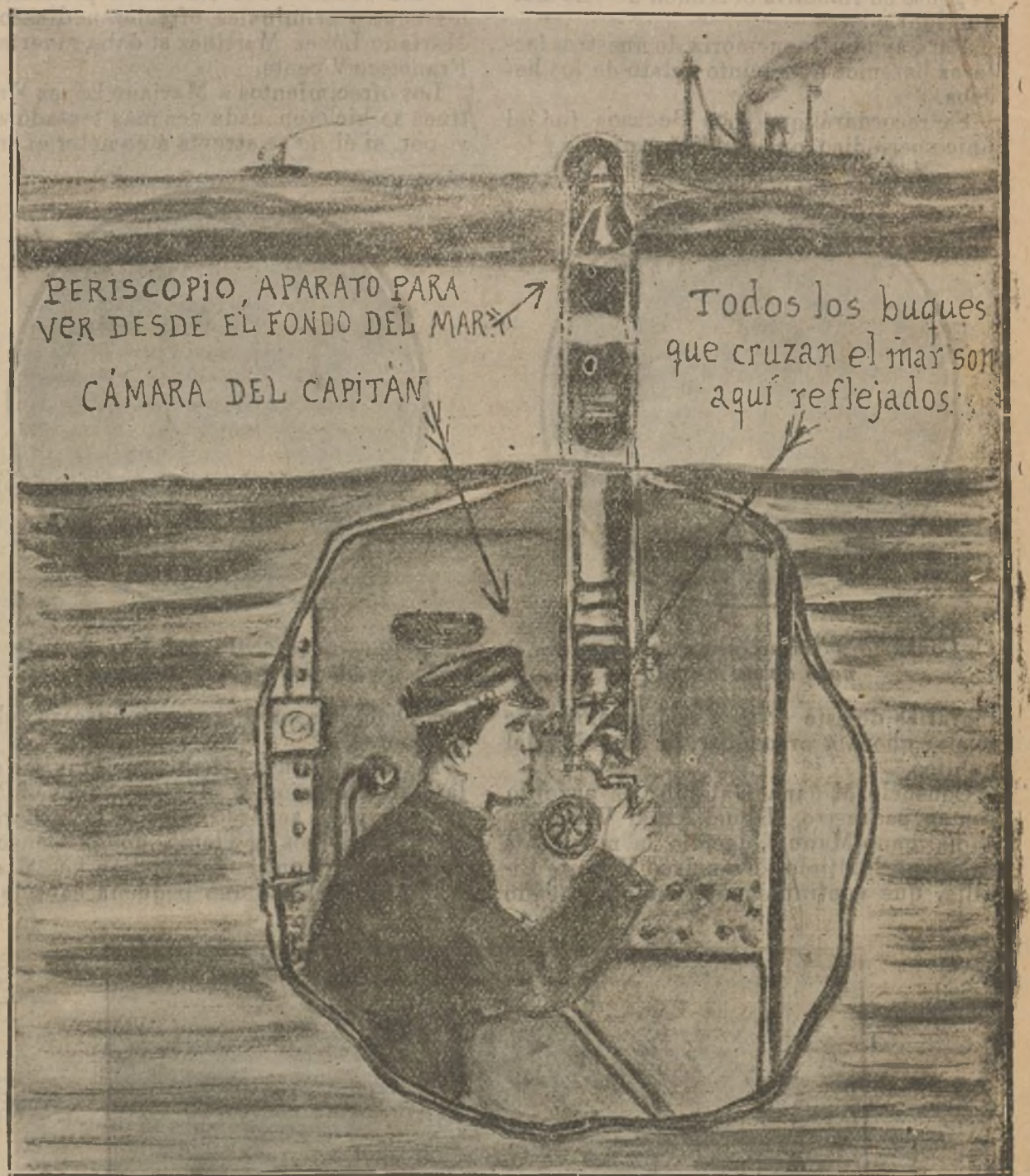
La aparición de un submarino alemán en Cartagena ha causado honda emoción. ¿Cómo ven y se dirigen los submarinos? Con el aparato aquí representado, que se llama periscopio. Con él se observa todo el horizonte, estando el buque sumergido. Fué inventado por el gran marino español Isaac Peral

Conquista de la raza latina presentada al mundo por el español Peral, que tuvo de su Gobierno por toda recompensa la Cruz del mérito naval con distintivo blanco!