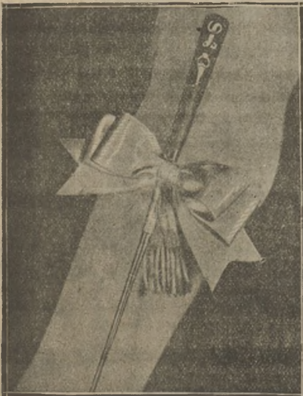
Ya no son solo las españolas las que llevan la navaja en la liga. Esta leyenda es ahora una realidad en las amantes de los «apaches» que ocultan así el estilete ó el puñal

La curiosidad del público en Cartagena fué emocionante, pero con tan delicada sensatez y corrección, que los marinos alemanes estaban asombrados de la admirable y ejemplar conducta del pueblo.