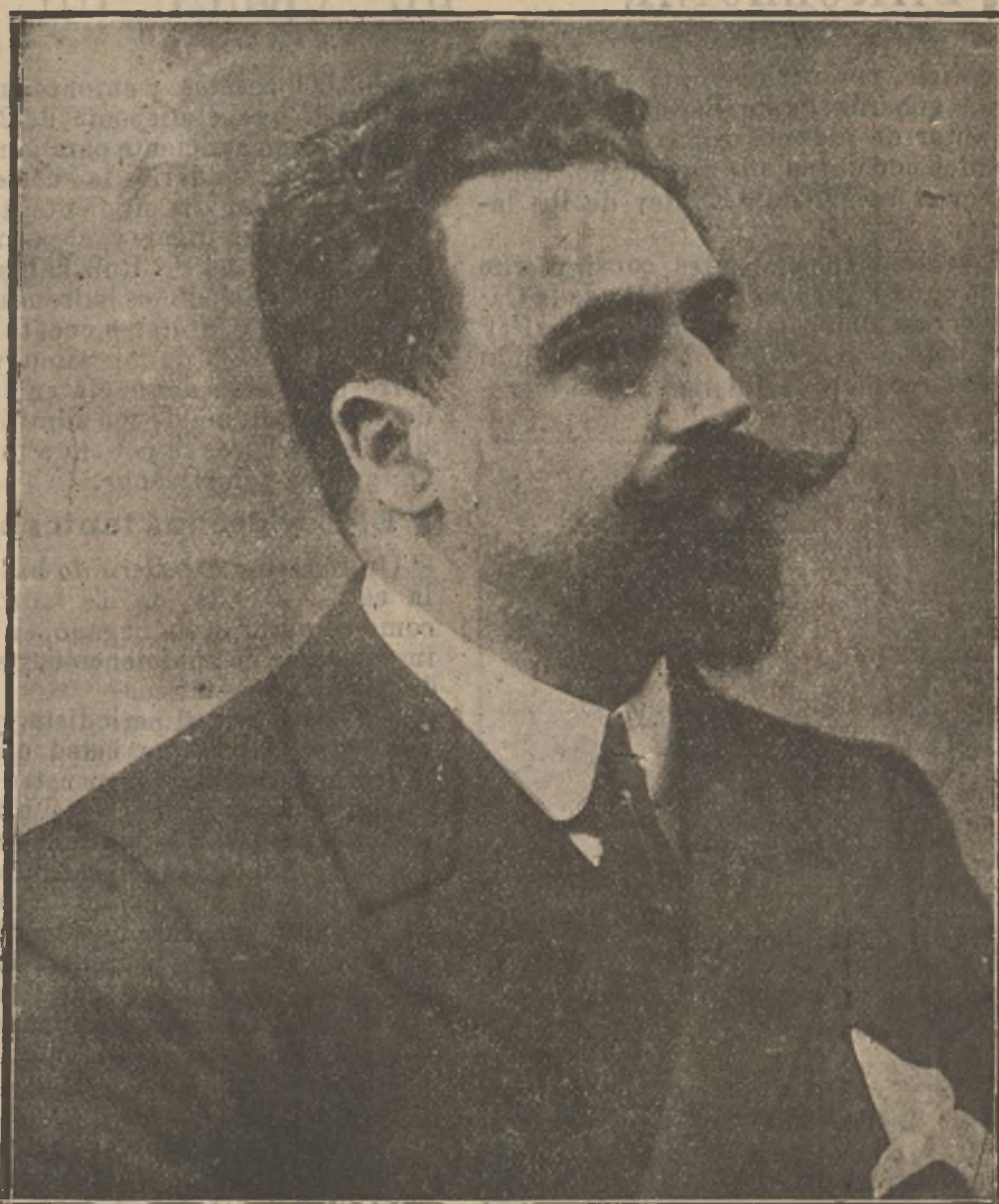
El ministro de Hacienda D. Santiago Alba. Es la figura del día. Con admirable tesón defiende su proyecto contra la codicia desatentada y ruin de los risachones y millonarios, egoístas y antipatriotas.

No debieron ser muy claras las manifestaciones de la presunta mujer martirizada.