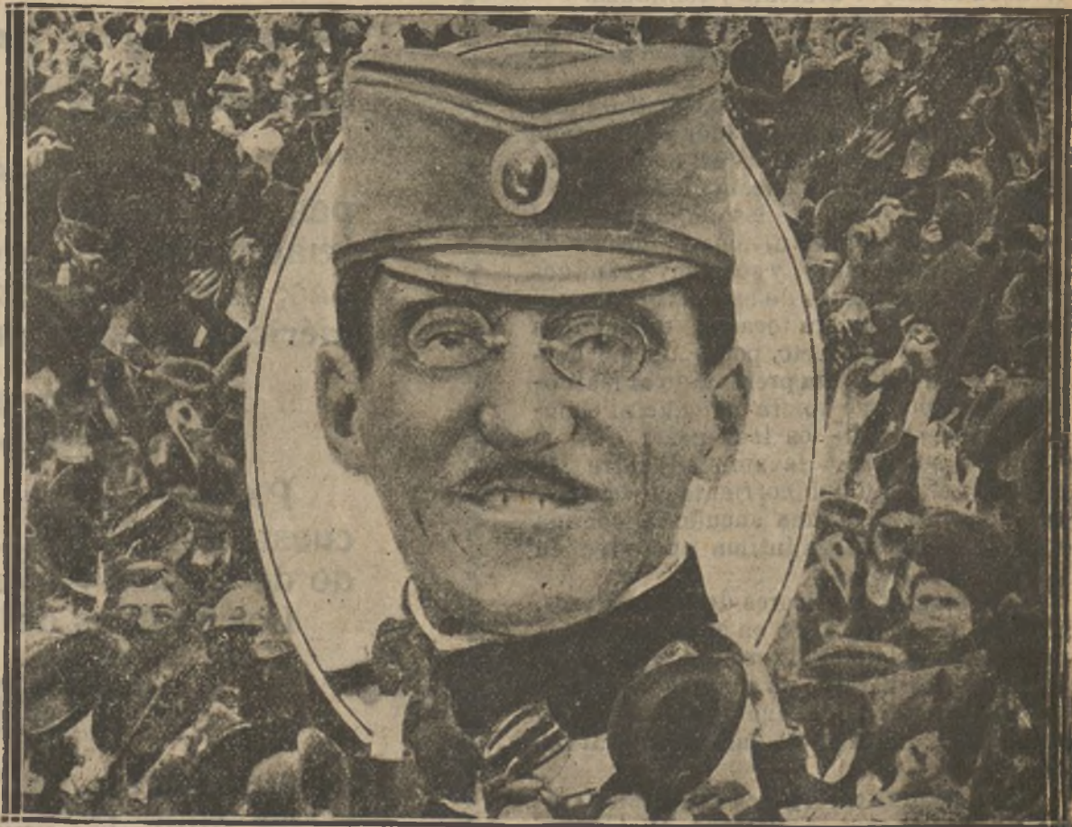
El príncipe heredero de Serbia, que ha estado en Madrid, de incógnito, conferenciando con el rey D. Alfonso. — Está retratado a su llegada a París, donde tuvo aclamaciones delirantes del pueblo.

La Infanta Isabel asistió a la despedida del bravo torero, obsequiándole con una petaca de oro con esmalte.