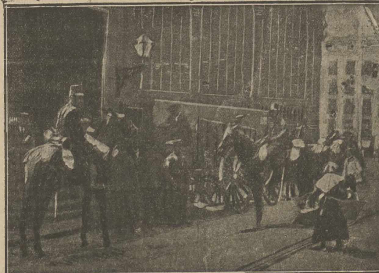
La huelga de los duques de carros en Madrid. — Carros de Intendencia descargando verduras en la plaza de la Cebada, protegidos por soldados de caballería.