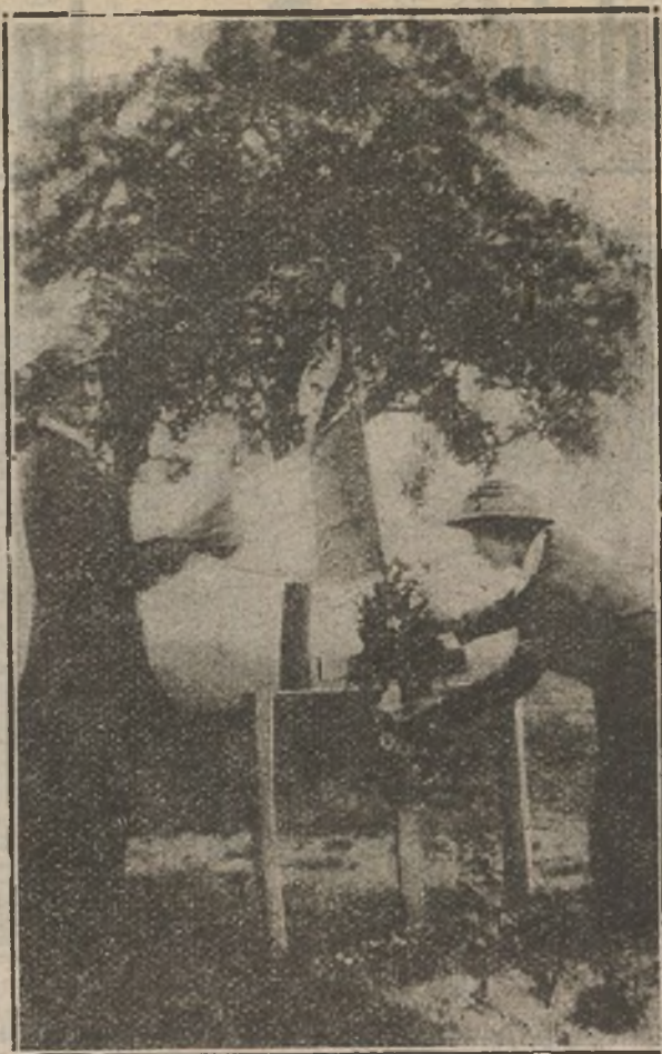
Señoritas francesas depositando flores y coronas en las tumbas de los soldados muertos en la batalla del Marne, donde fué derrotada Alemania.