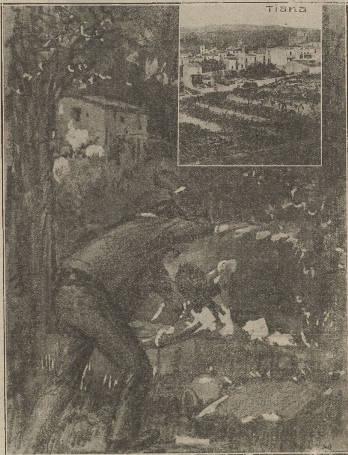
Violación y asesinato de una hermosa niña, en Tiana (Barcelona). El salvaje criminal estranguló a la infeliz criatura, huyendo, sin que se sepa su paradero.

trarrestar el terror pánico que ha producido el ya famoso bandolero, debieran establecer un premio para el que facilite su captura, o al que proporcione noticias exactas a la Guardia civil sobre el paradero del bandido.