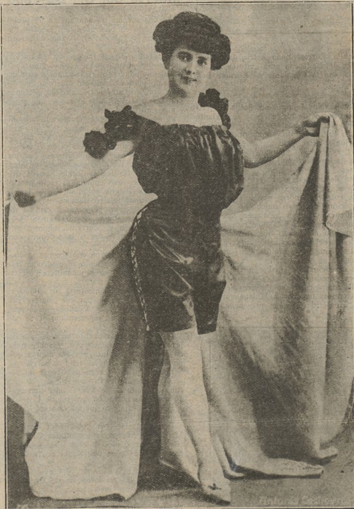
La famosa cupletista Antonia "La Cachavera", procesada por denuncia del alcalde de La Unión (Murcia).