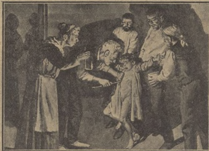
Reproducción de la escena del crimen.