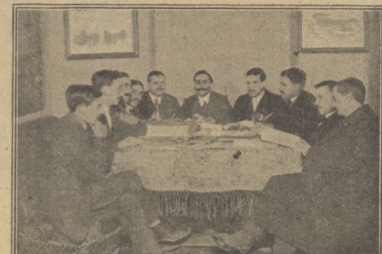
Presidentes de las secciones tomando acuerdos sobre el conflicto.