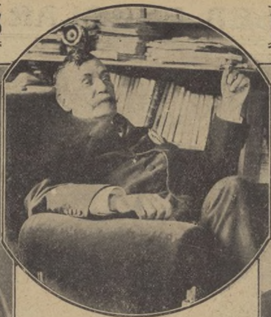
El ilustre escritor D. Benito Pérez Galdós, á quien se desea se conceda el próximo premio Nobel.

Hace pocos días los amigos y admiradores del gran músico D. Tomás Bretón, obsequiaron al maestro con un banquete que se celebró en el Salón de Co.