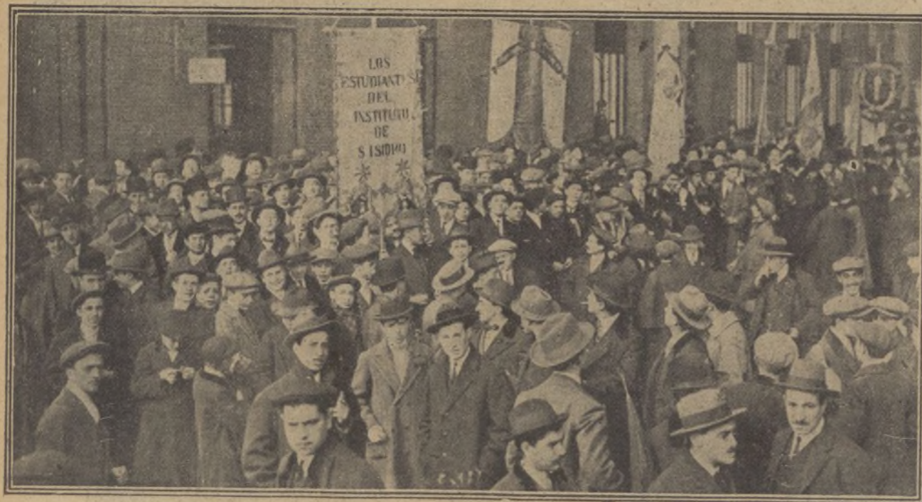
Grupos de estudiantes esperando á sus compañeros barceloneses.