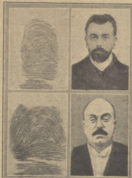
Casi idéntico al anterior. Las huellas del dedo no cambian.

Las líneas espirales que deja la impresión del dedo son siempre las mismas, son invariables en cada individuo y no hay dos personas en el mundo que presenten la misma impresión. Es el reflejo más personal, la mejor contraseña, y los chinos ha-