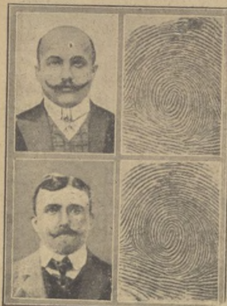
Diferencia de rostro de un criminal en el término de un año.

Varios crímenes, de los que no tenemos espacio para dar cuenta de ellos, han sido descubiertos últimamente por la dactiloscopia; y que sin ese auxiliar hubiesen quedado ocultos.