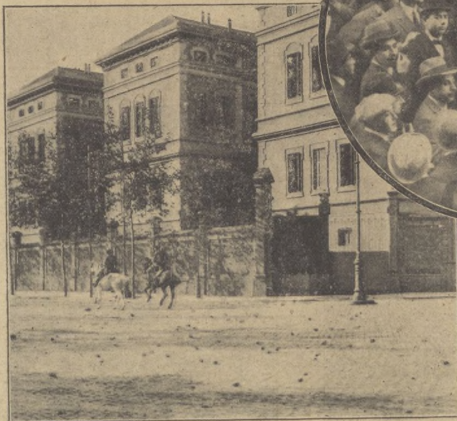
Las fuerzas de Orden público vigilando el Hospital durante el conflicto.