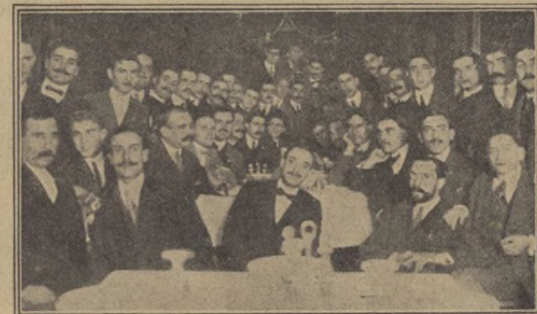
Banquete de los estudiantes de Veterinaria á los comisionados.