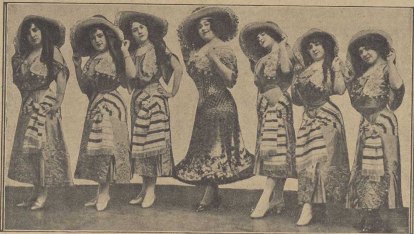
Las tiples del Gran Teatro en la habanera Mandanga de la obra "El Paraguas del Abuelo".

Siete mujeres bonitas, siete tiples del Gran Teatro, cantan la habanera de la Mandanga en la obra "El Paraguas del Abuelo", obra estrenada con gran éxito en el citado coliseo.