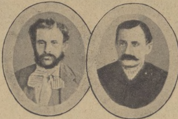
Retrato de un criminal perseguido por la policía.

Cuántos retratos no hemos visto de una persona y hemos exclamado al decirnos: "mire usted, este soy yo".