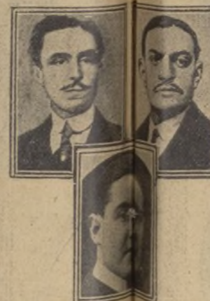
Vicepresidente, Secretario y presidente de la Asamblea Escolar.