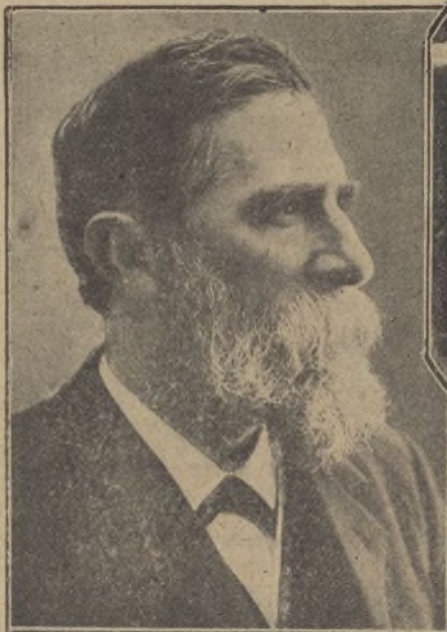
El maestro Bretón que fué obsequiado por sus admiradores con un banquete en el salón de cotizaciones de la Bolsa.