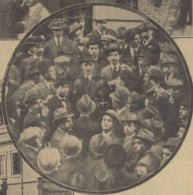
El rector de la Universidad dirigiendo la palabra á los estudiantes después del tiroteo.

El artículo de doña Rosario de Acuña, titulado "La jarka de la Universidad", publicado en el "Internacional", de París, y copiado por "El Progreso", de Barcelona, ha sido causa de que en la capital de Cataluña surgieran desagradables trastornos de orden público, y hubiese cargas y tiros con funestos resultados.