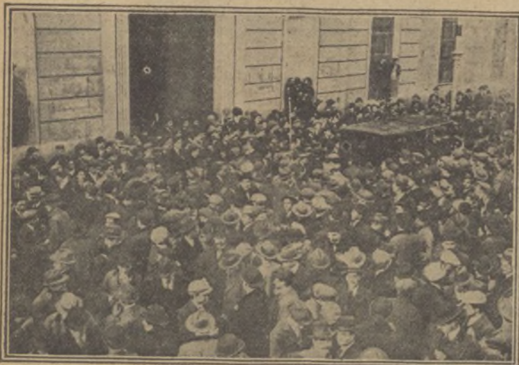
Salida del ministro de Instrucción pública de la 1.ª Asamblea