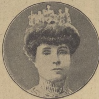
La infanta doña Eulalia, que va á publicar un libro titulado "Au fil de la vie".