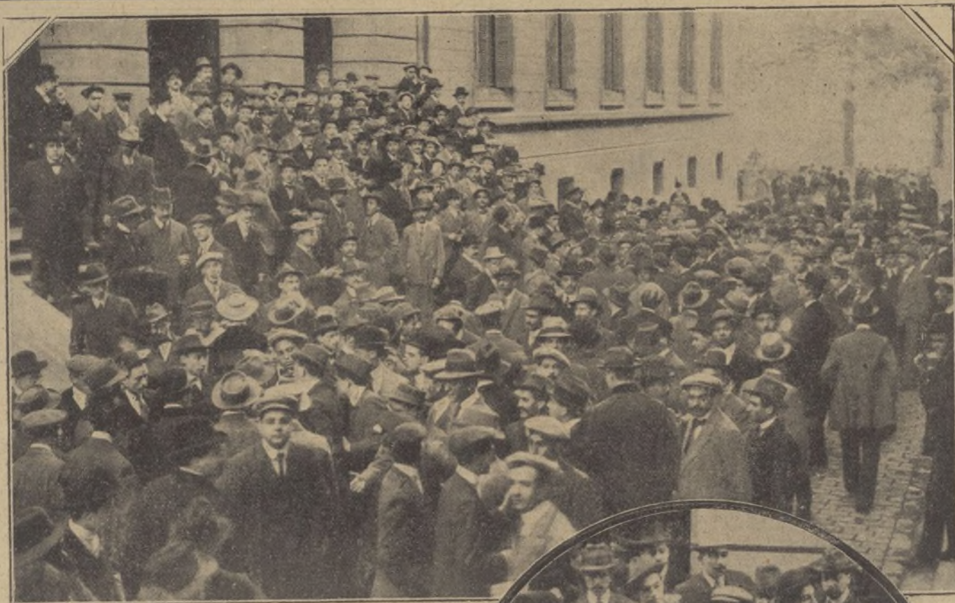
Aspecto del Hospital Clínico durante la reunión de estudiantes en que se acordó la manifestación.