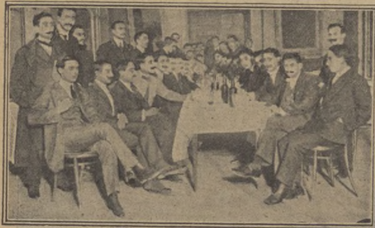
Los presidentes de las comisiones en el Hotel de Barcelona.