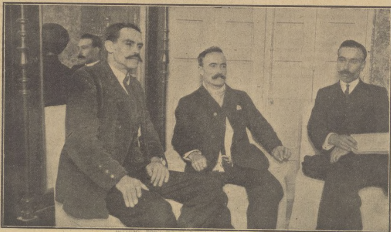
Comisión de ferroviarios andaluces que ha venido á Madrid á conferenciar con el ministro de Fomento para solucionar el conflicto.