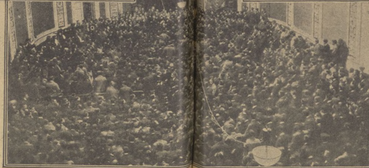
El Paraninfo de la Universidad durante la inauguración de la Asamblea Escolar.