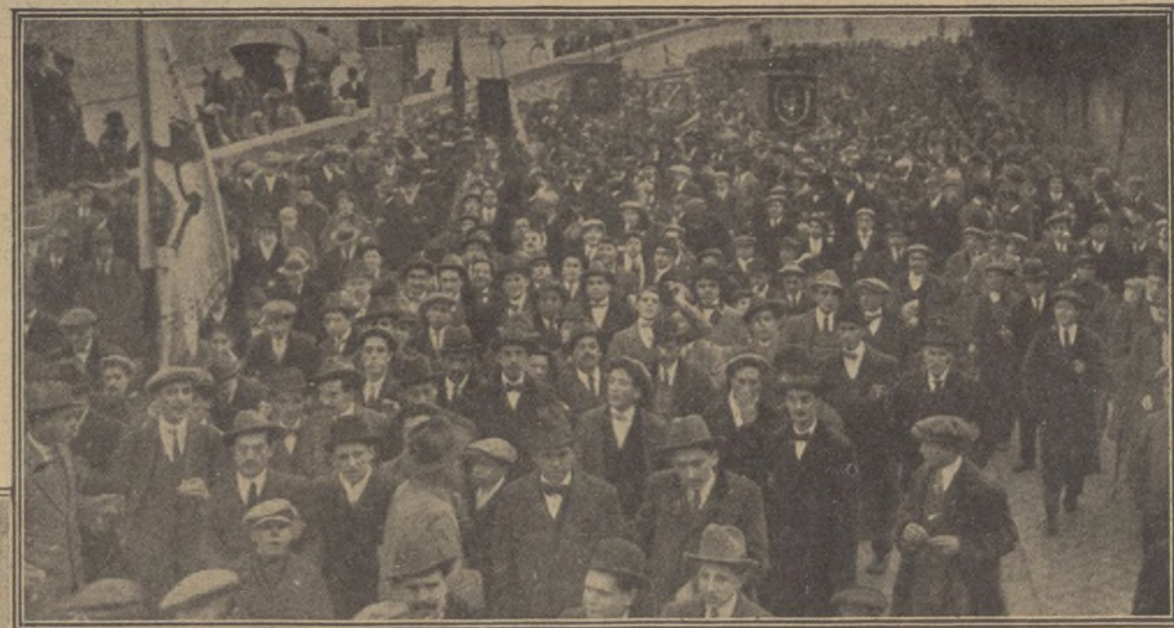
Estudiantes madrileños recibiendo á los comisionados de Barcelona.