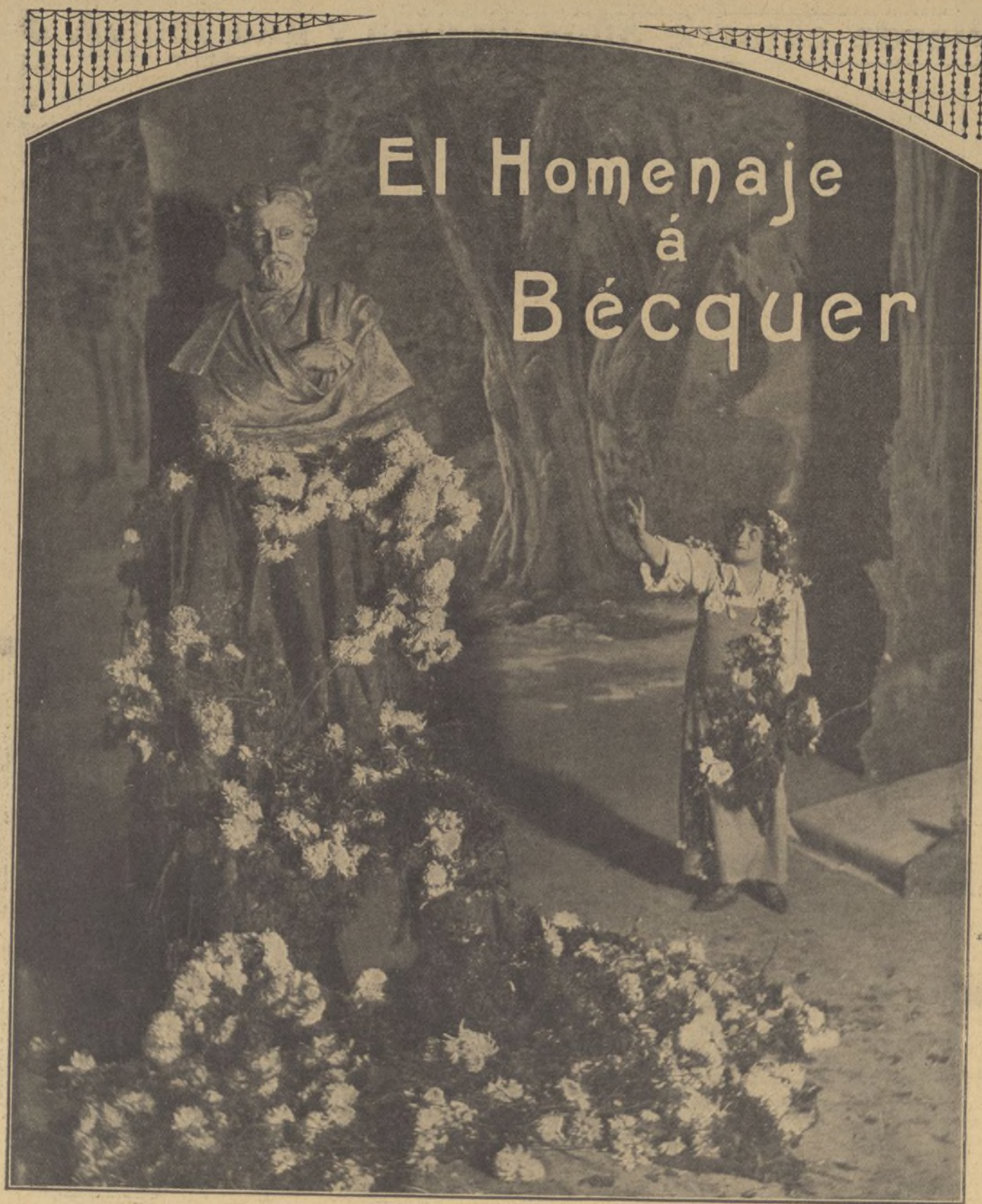
La notable actriz María Guerrero en "El Ensueño de la Ensoñadora", obra escrita por los hermanos Quintero para la función celebrada en Sevilla en honor á Bécquer. (Fot. Dubois).

En Sevilla se ha inaugurado un notable monumento dedicado al exquisito poeta Bécquer, obra del escultor Coullant Valera y que promovida por los hermanos Quintero, ha sido llevada á feliz éxito.