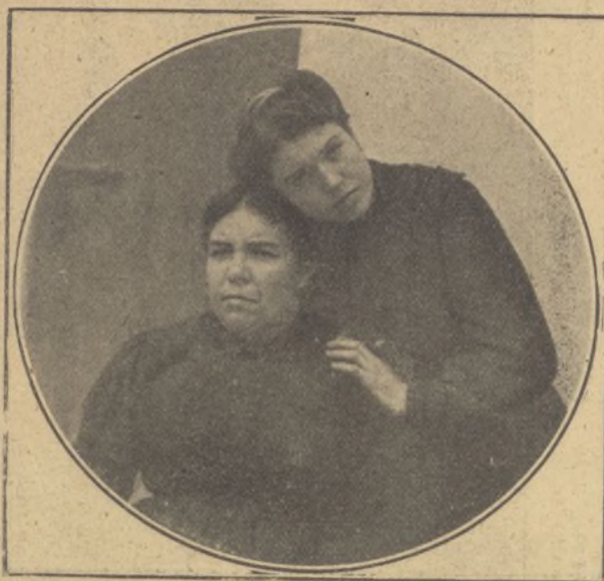
La mujer y la hija del alguacil asesinado en Cullera.

El fiscal formuló siete peticiones de penas de muerte, pero sólo parecen confirmadas las que recaen sobre Juan Jover Corral (Chato de Cuqueta) y Cecilio San Félix (Panchito).