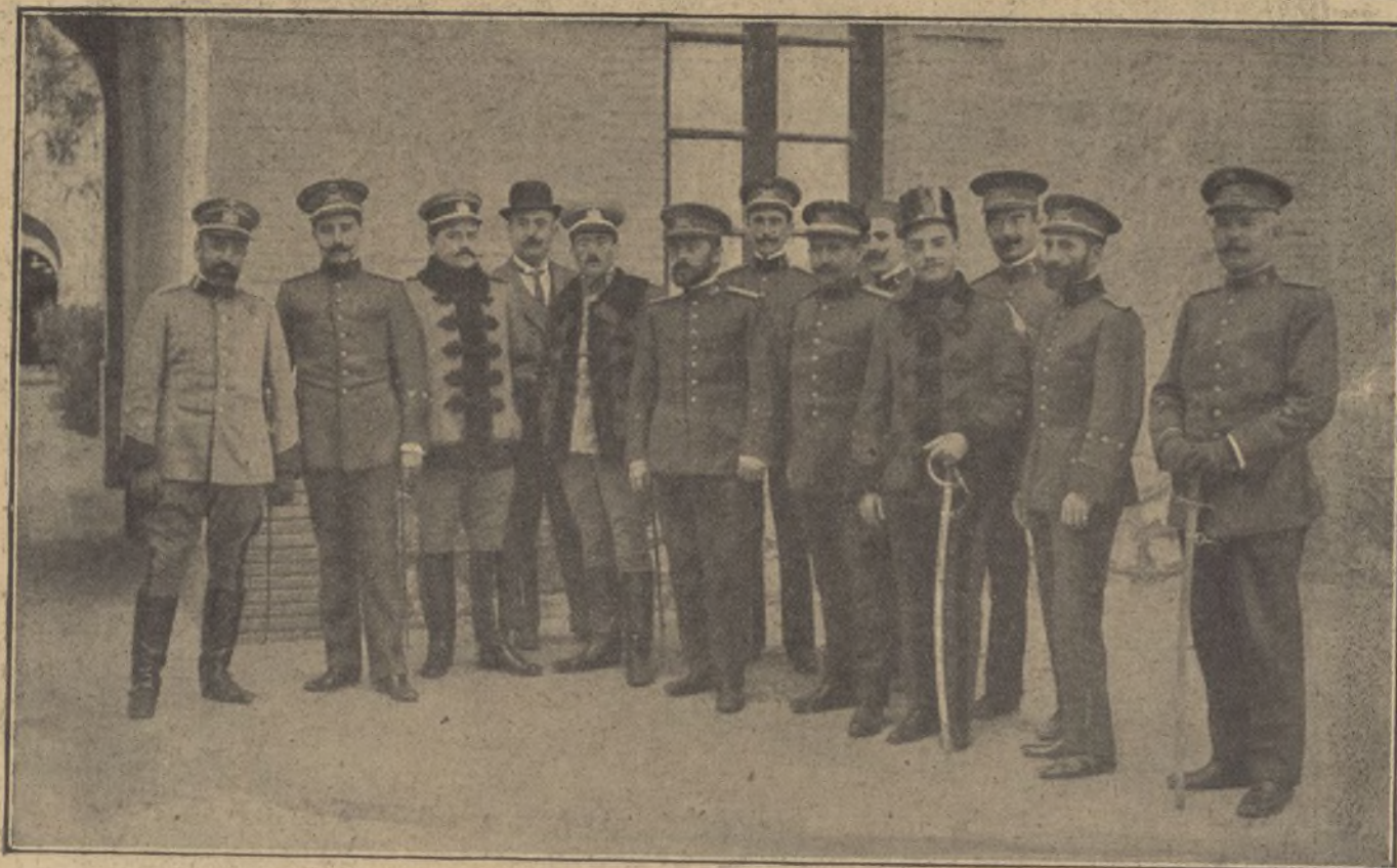
El juez instructor y los defensores de los procesados por los crímenes.