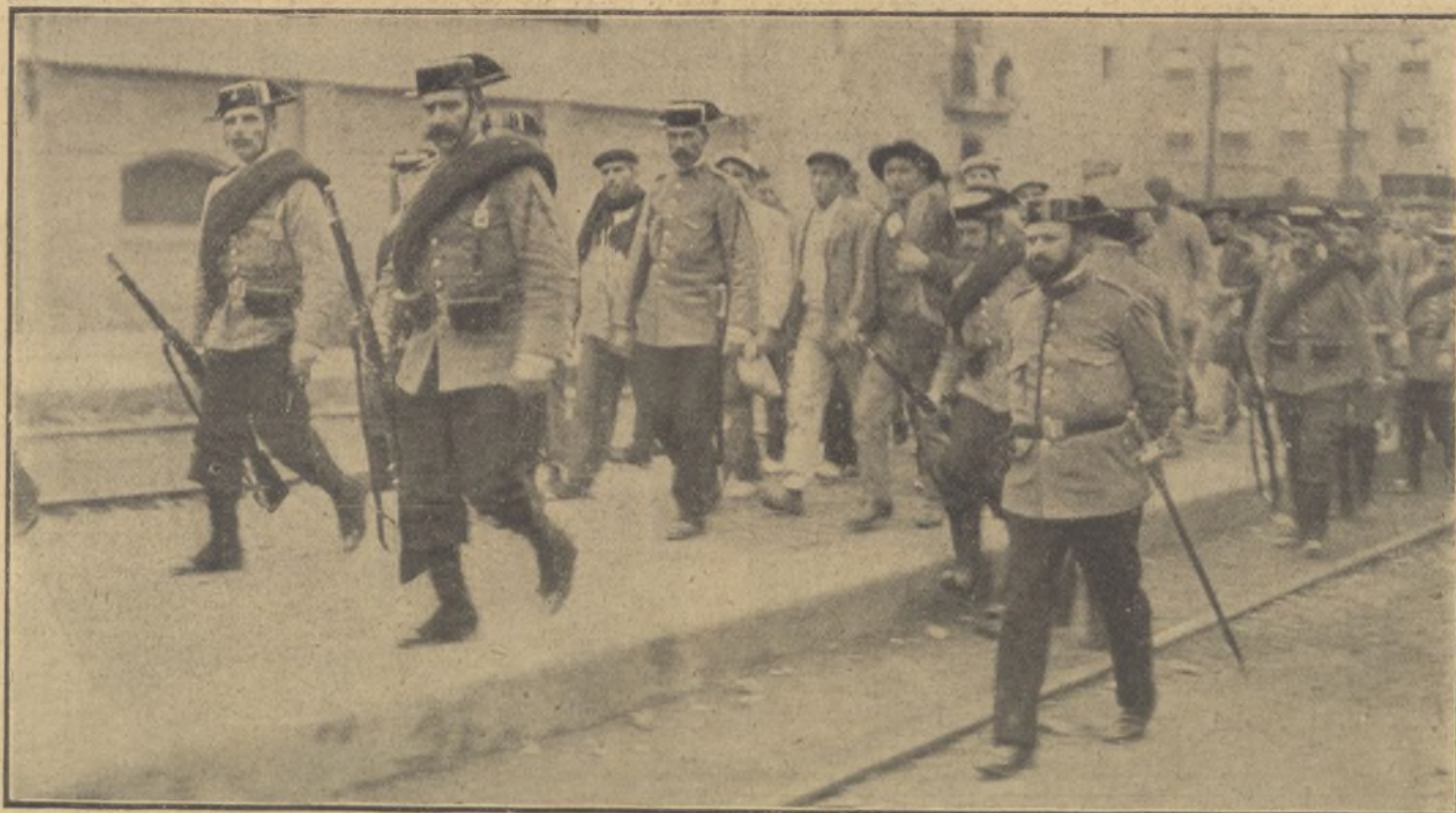
Los procesados, conducidos por la Guardia civil al Consejo de Guerra.