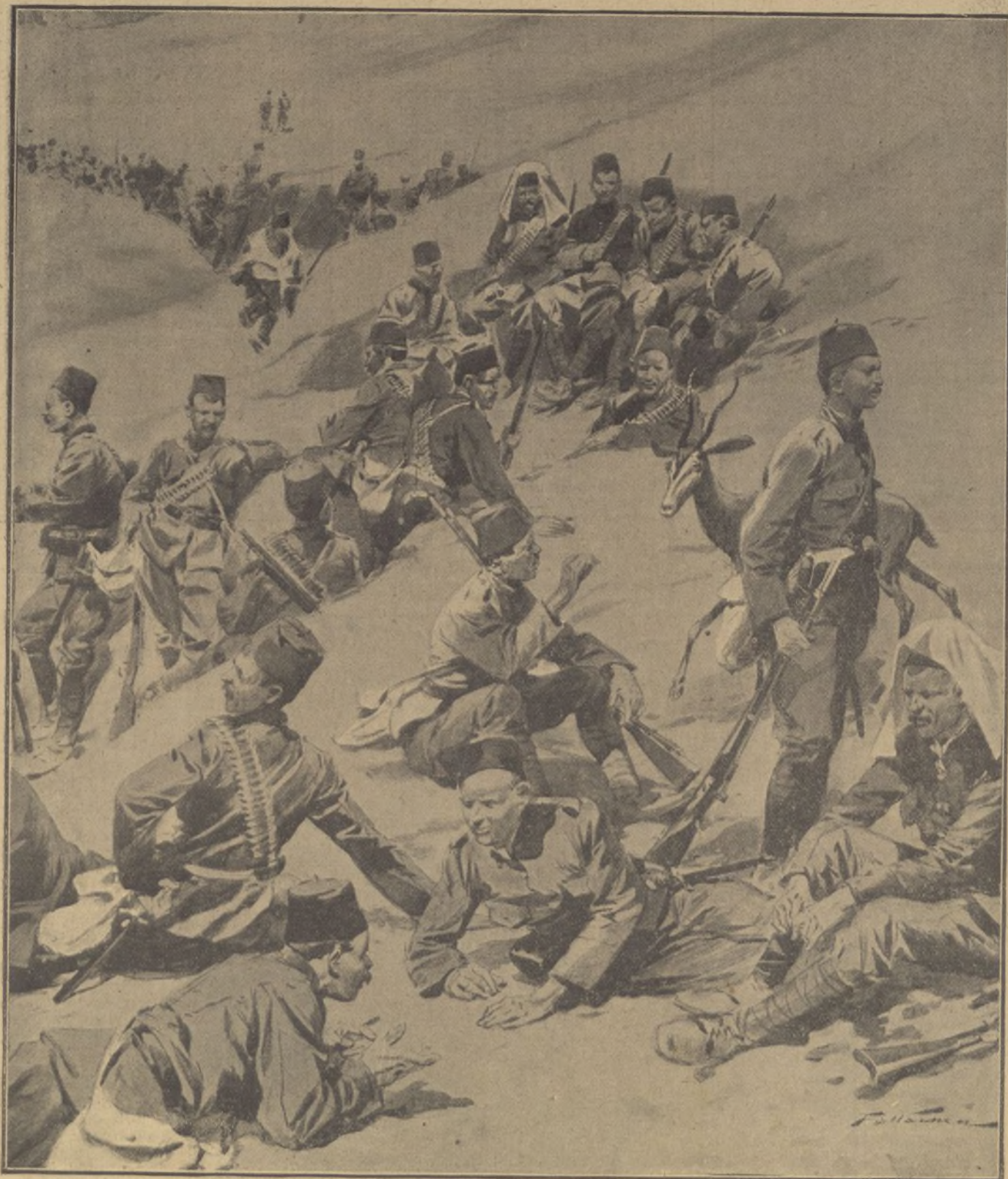
Campamento turco en la guerra contra Italia.