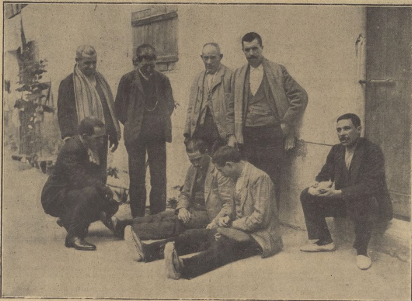
Grupo de algunos de los procesados descansando en el patio de la cárcel.